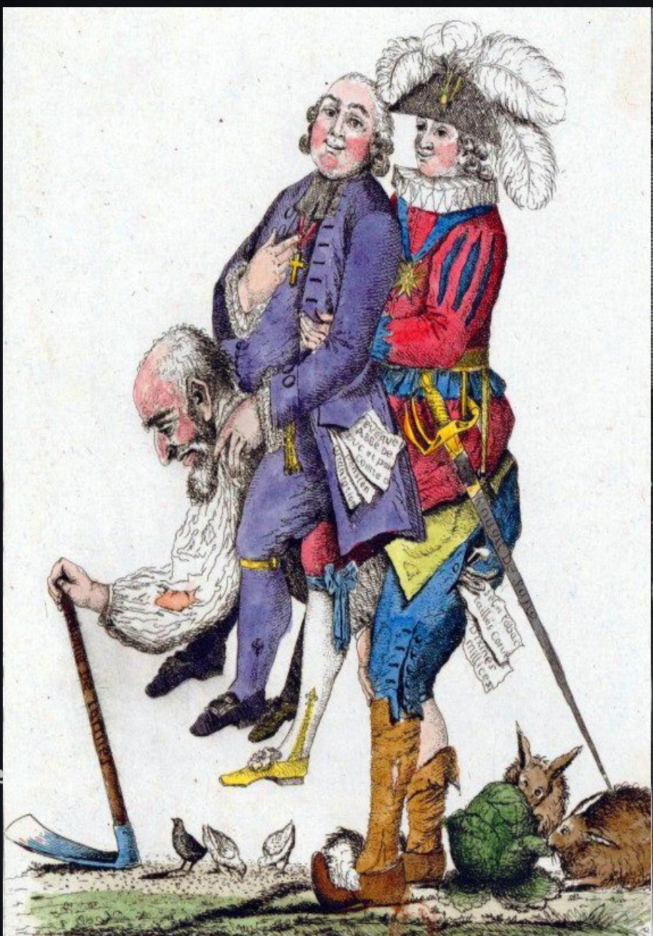
A FAUT ESPERER Q'EU JEU LA FINIRA BENTOT