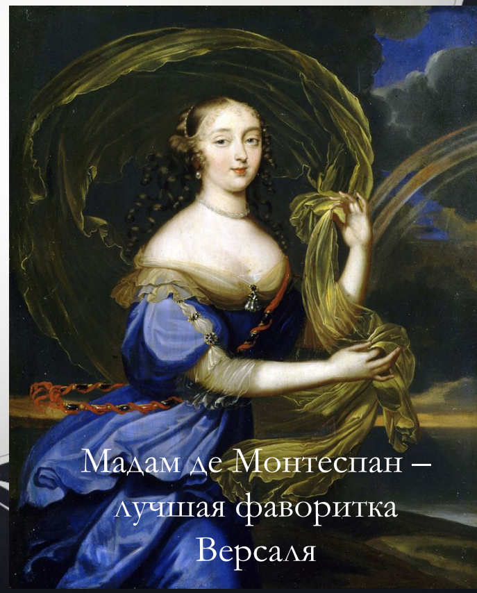
Мадам де Монтеспан — лучшая фаворитка Версаля