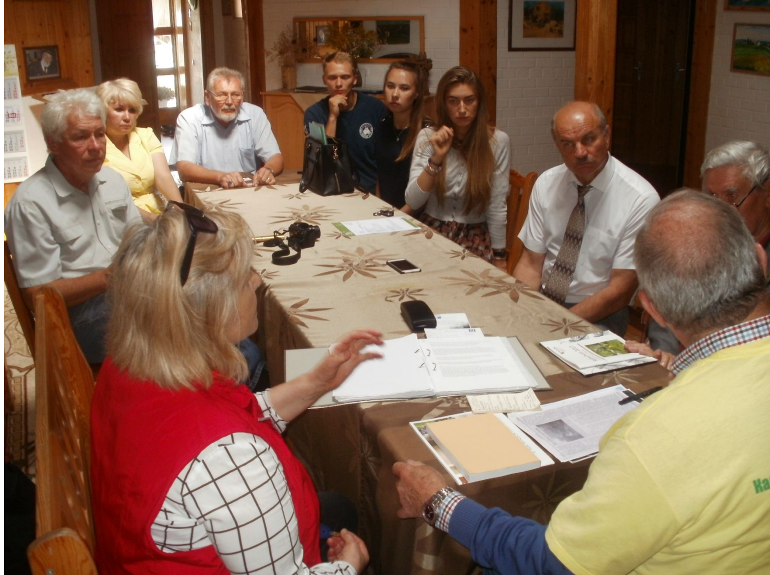
Итоговое заседание инициативной группы по возрождению виноградарства Калининградской области и подписание протокола