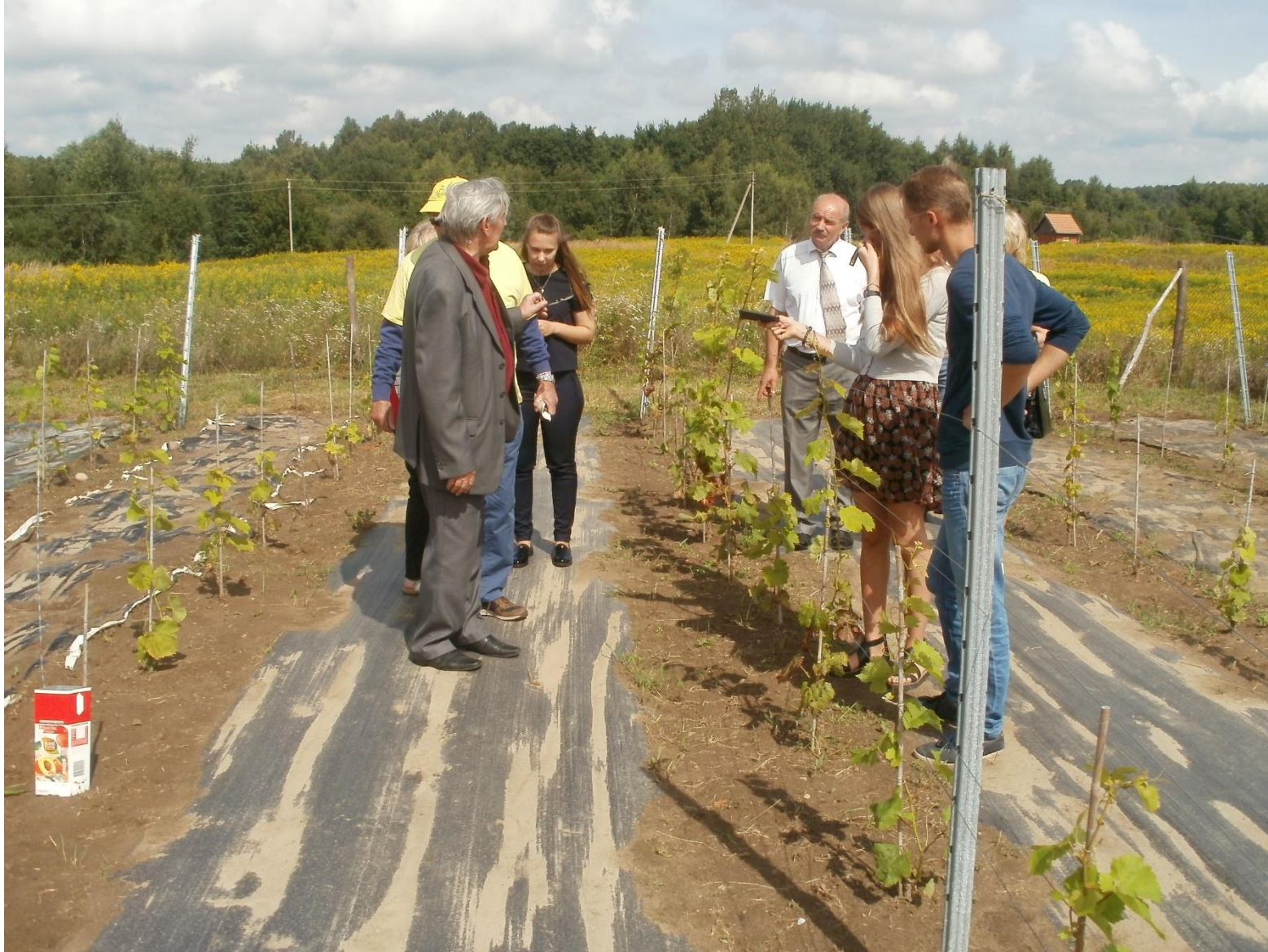
Обсуждение эффекта мульчирования плёнкой