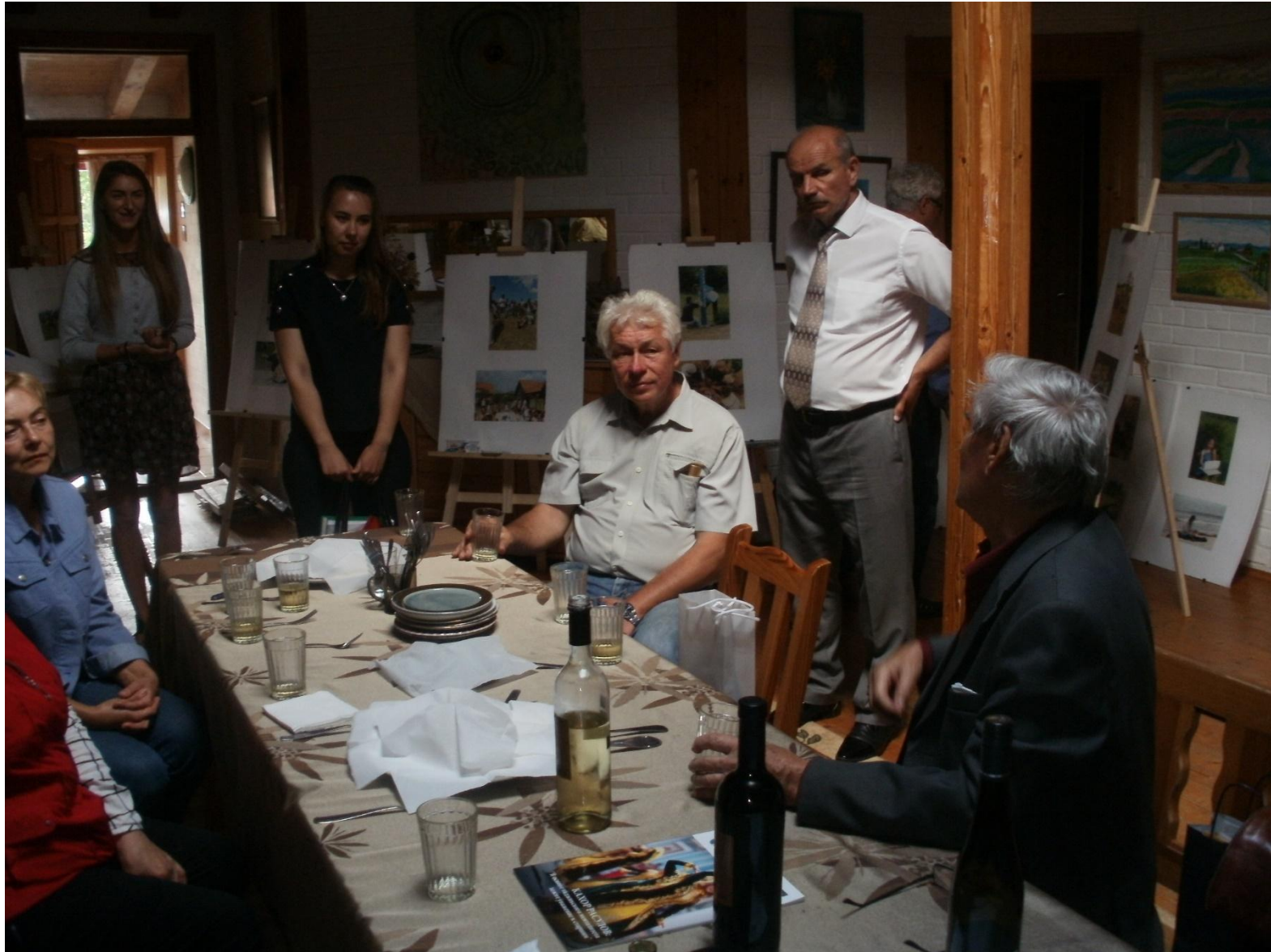
Дегустация испытываемых сортов винограда Германии