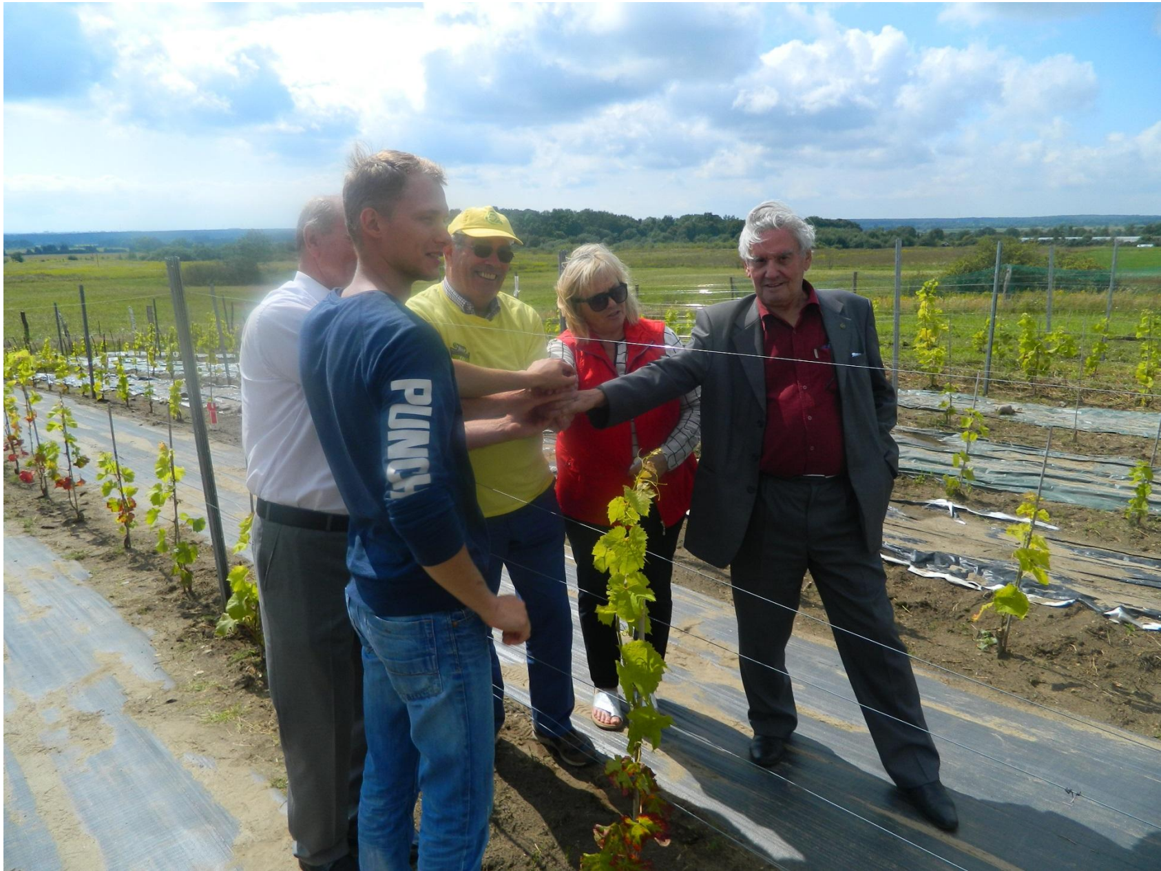
Рукопожатием закрепили достигнутые соглашения