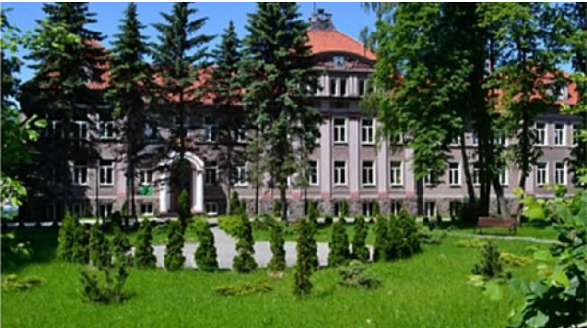
Основное здание КФ