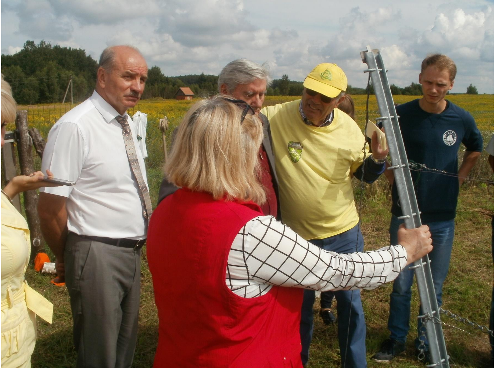
Дискуссия о формировании кустов винограда