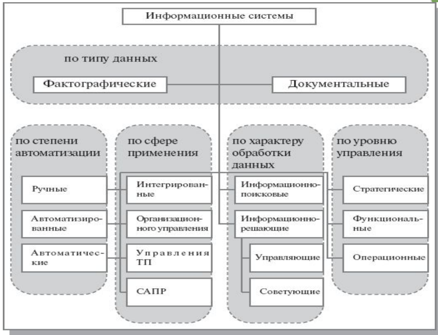
Классификация информационных систем