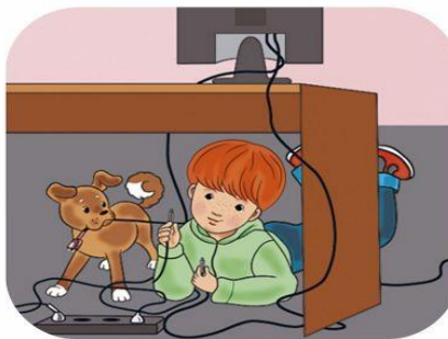
Не играй с розетками!