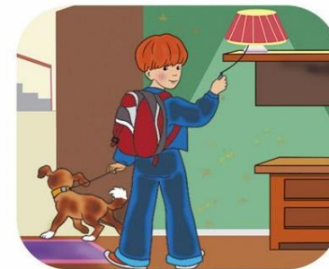
Уходя из дома, гаси свет и отключай электроприборы!