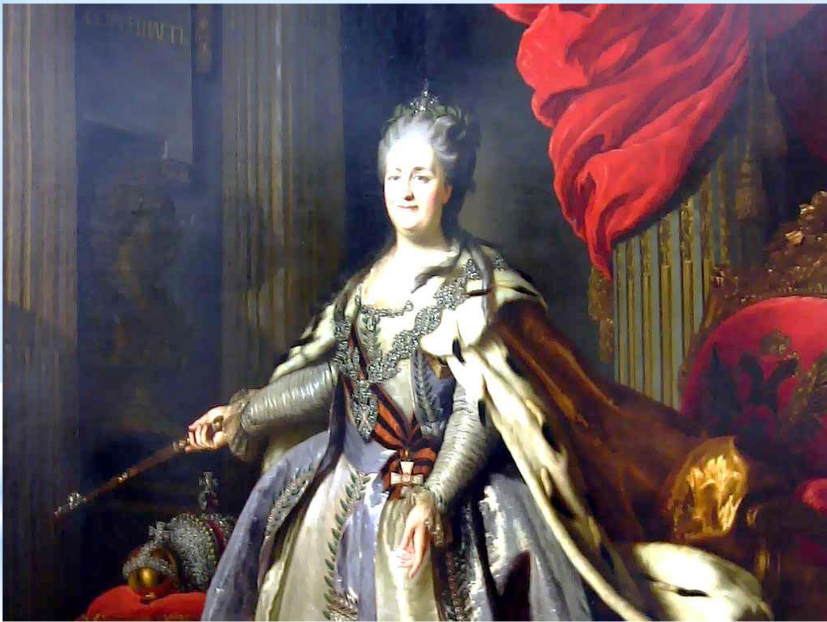
Екатерина II (Великая)