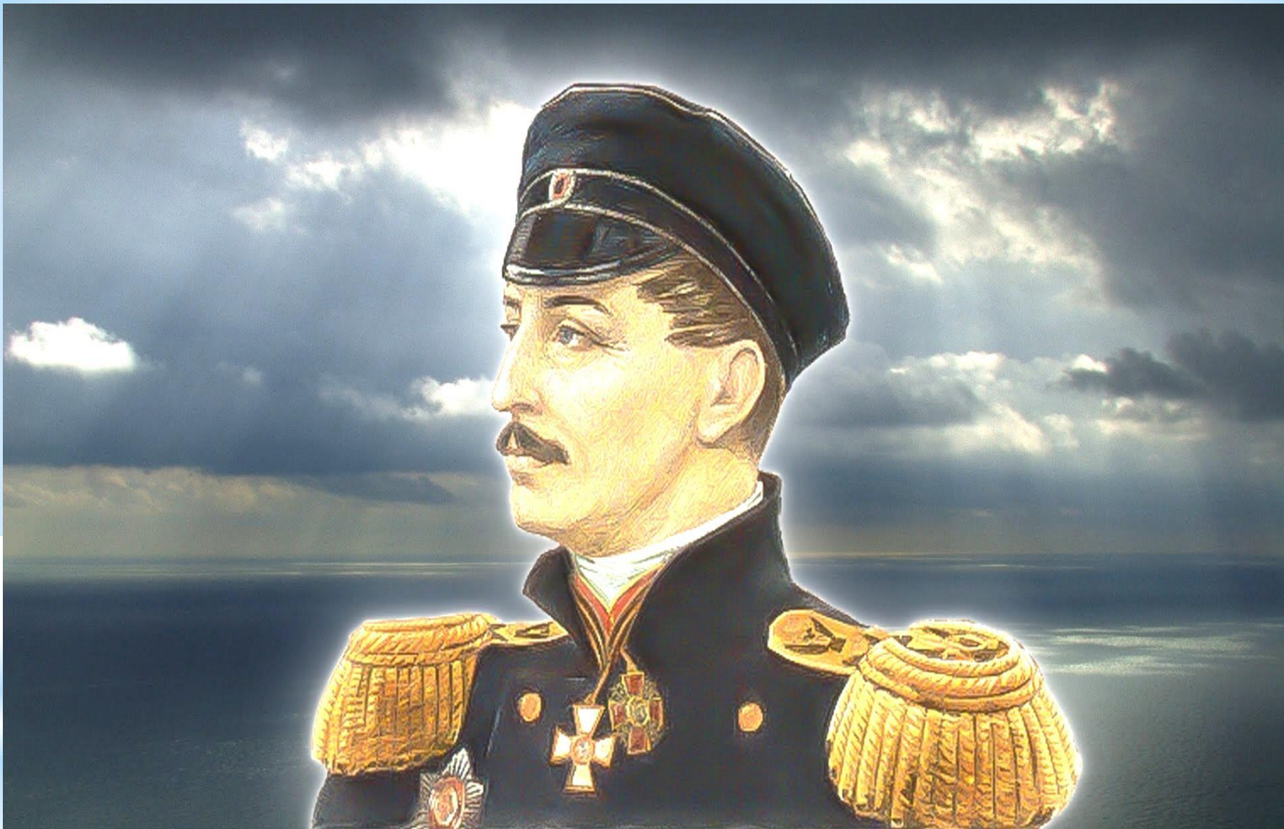
Павел Степанович Нахимов