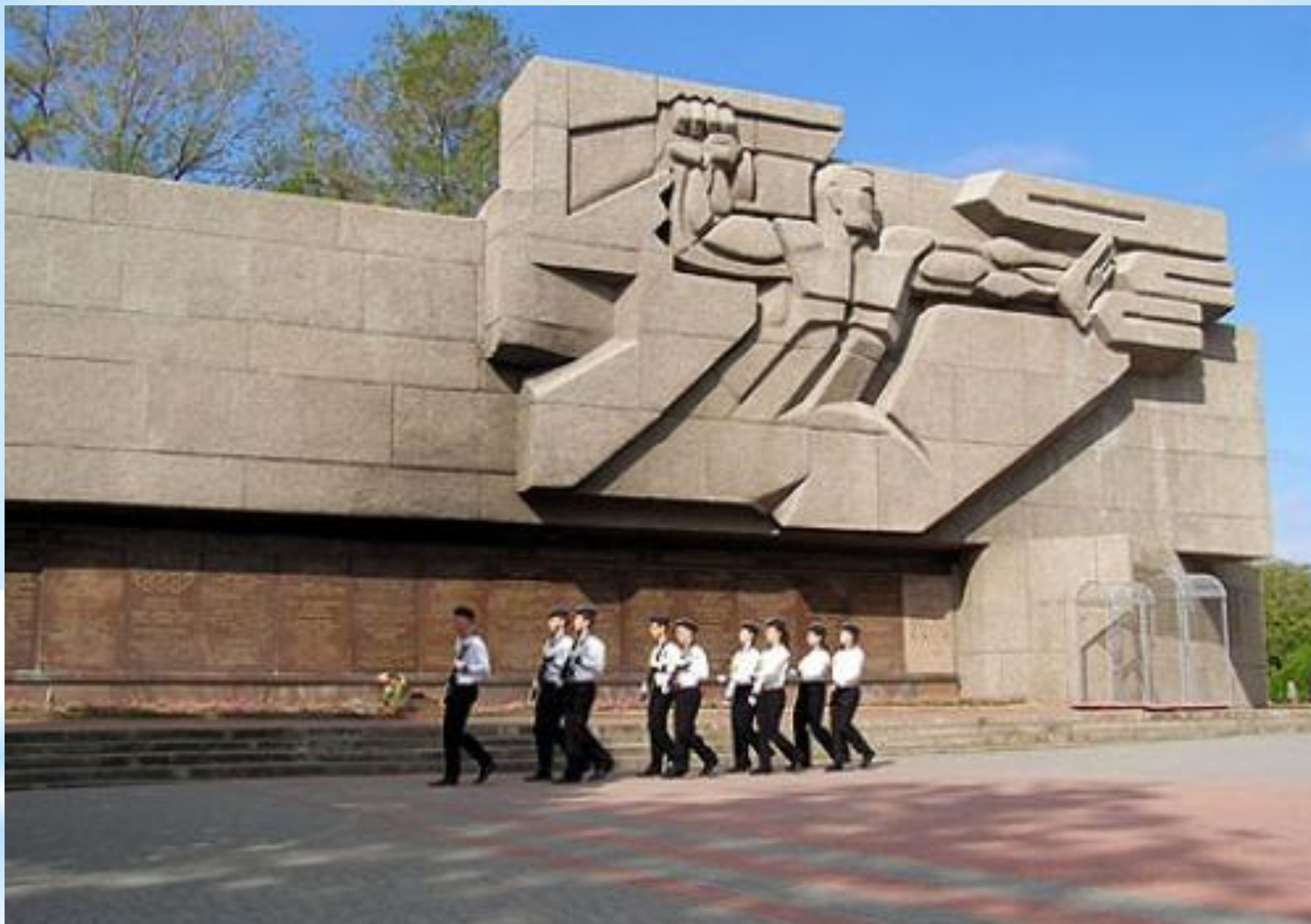
Мемориал героической обороны Севастополя 1941-1942 гг.