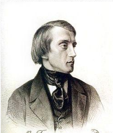
В.Г. Белинский (1813-1848) литературный критик, публицист