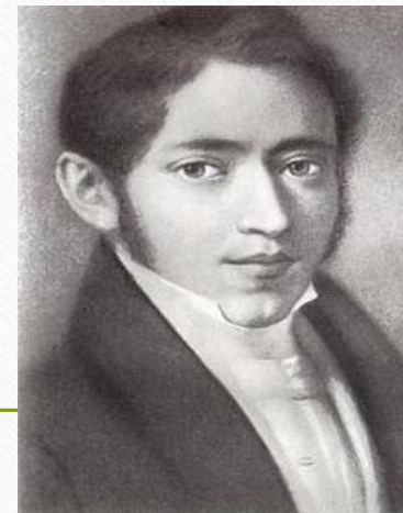
Н.П. Огарев (1813-1877) русский поэт, публицист, революционер

Западники исходили из принципа универсальности исторического развития человечества. Указывали на то, что наиболее продвинувшейся в процессе исторического развития (в силу ряда обстоятельств) оказалась Западная Европа, и потому ее опыт должны освоить все страны, в том числе и Россия.