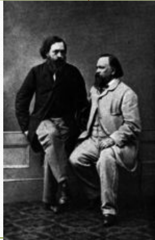
А. И. Герцен и И. П. Огарев в эмиграции