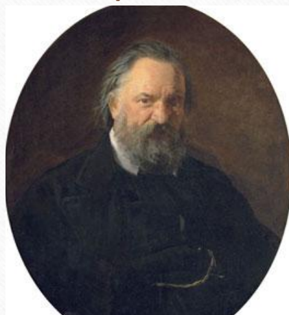
А.И. Герцен (1812 - 1870) русский писатель и революционер.

Западничество, как и славянофильство, возникло на рубеже 30—40-х годов XIX в. Оно было представлено "обеими столицами" — Москвой и Петербургом. Московский кружок западников оформился в спорах со славянофилами в 1841—1842 гг. В Петербурге же находились немногие представители западничества, и какого-либо сложившегося кружка его единомышленников не существовало.