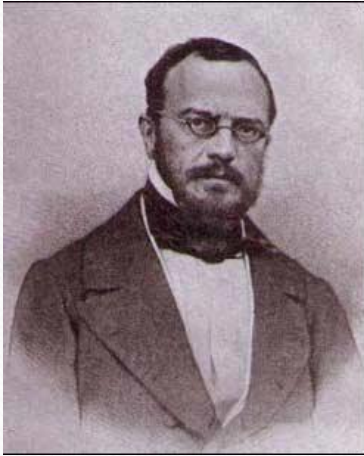
И.В. Киреевский (1806 - 1856) прозаик, критик, публицист, философ