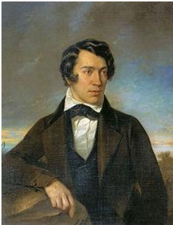
А.С. Хомяков (1804-1860) русский поэт, художник, публицист, богослов, философ