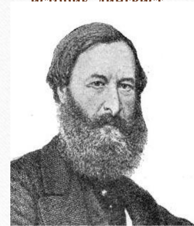
Ю.Ф. Самарин (1819-1876) публицист, критик, историк, общественный деятель