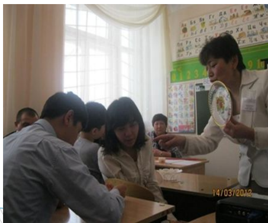
Көру, есту дамыту жаттығулары