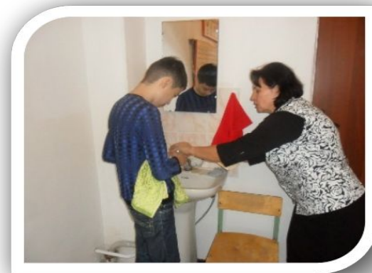
Әлеуметтік тұрмысқа бейімдеу ( үй шаруасына)