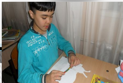
Ұсақ қол моторикасын дамыту жаттығулары