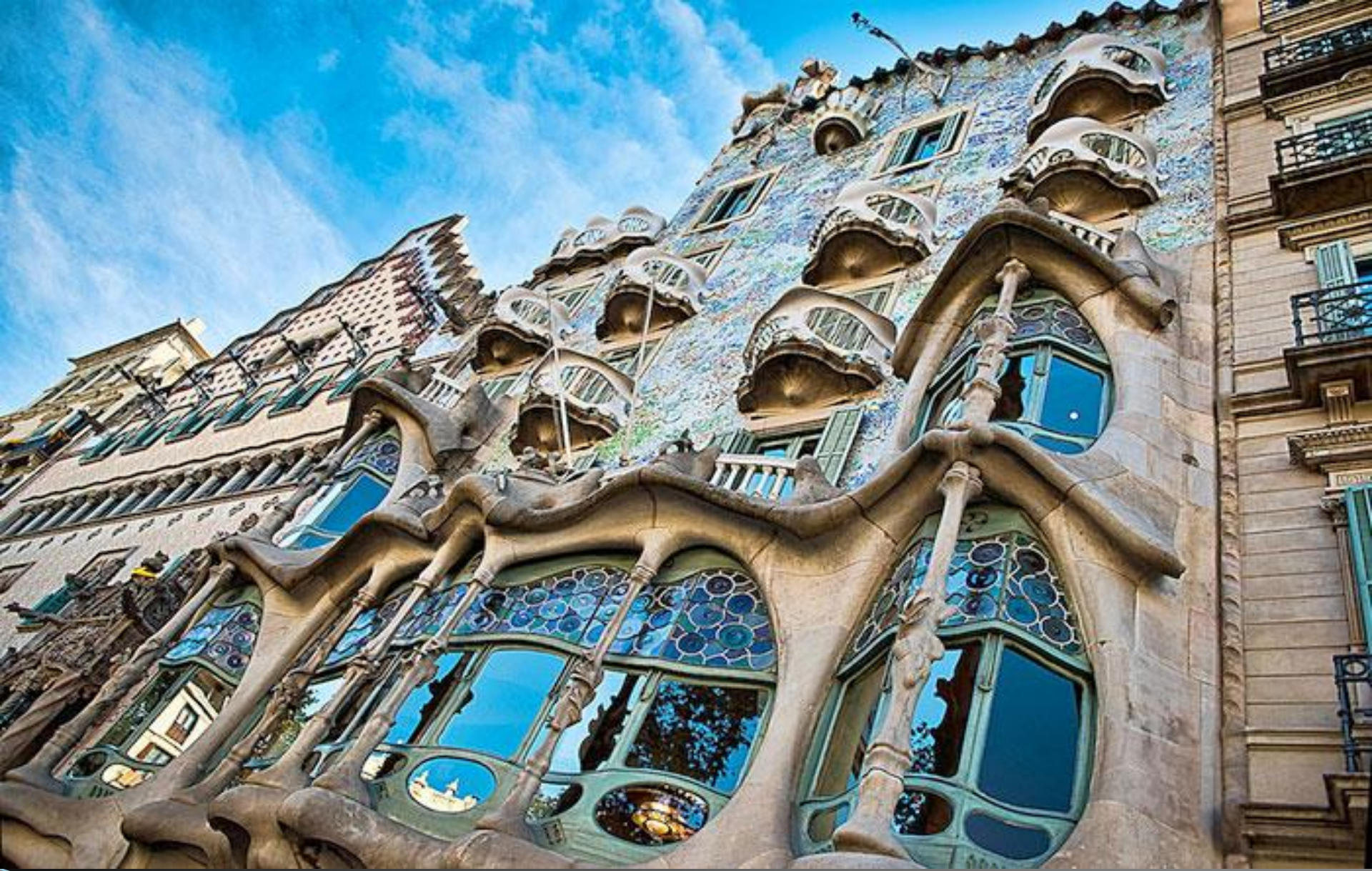
Дом Бальо или «Дом Костей»