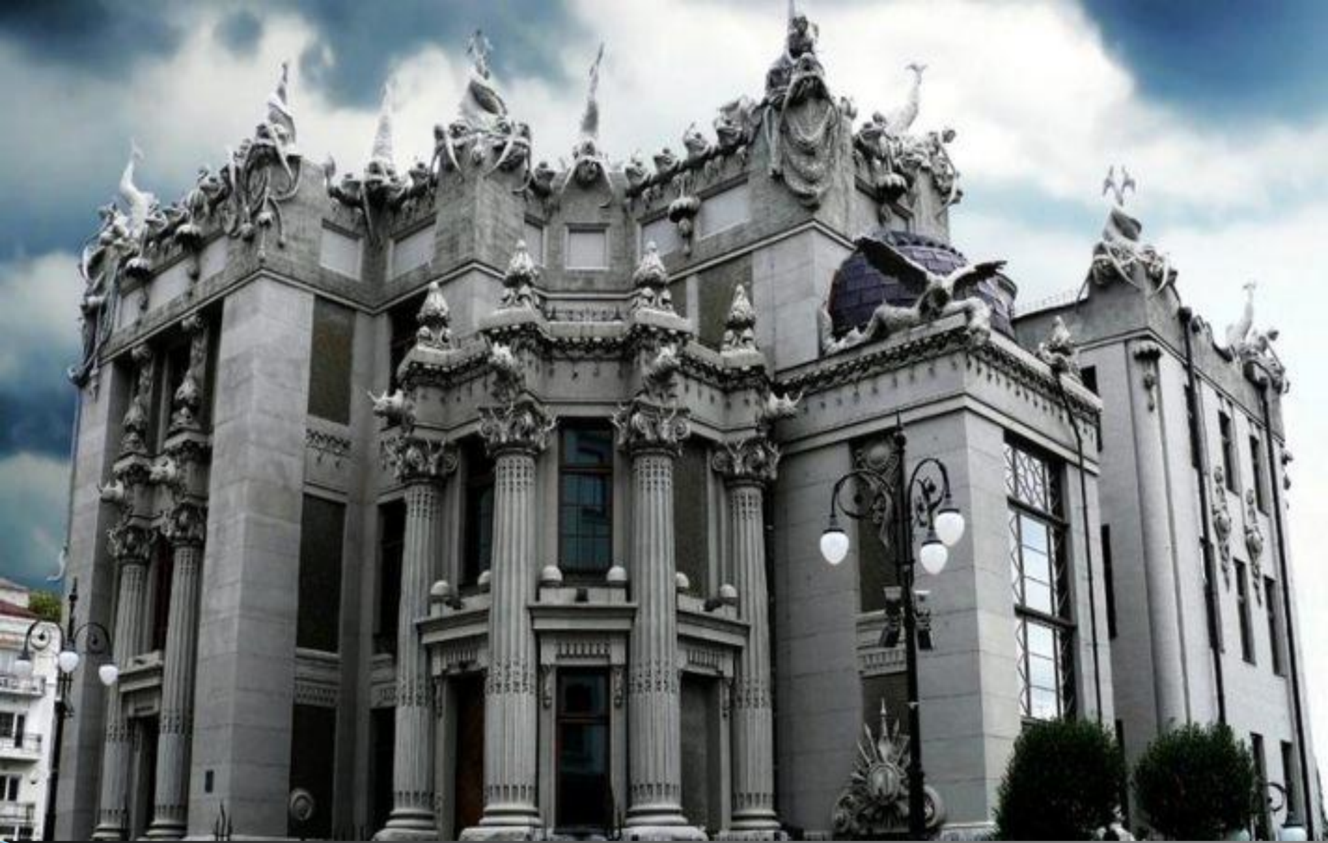
Дом с химерами