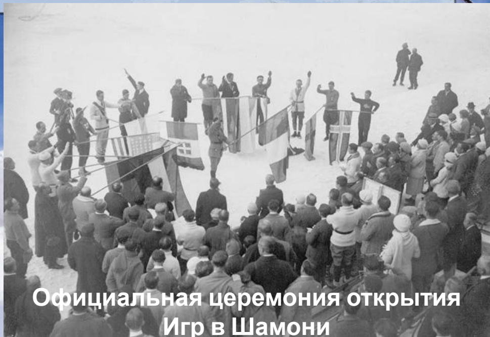
Официальная церемония открытия Игр в Шамони