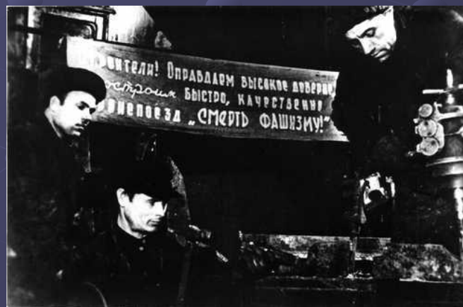
В цехе завода «Двигатель революции»