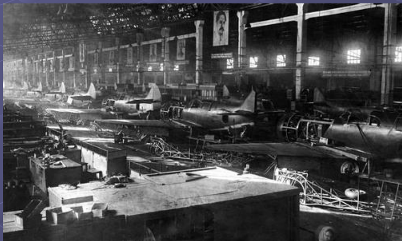
Сборка самолетов ЛА-5 на Горьковском авиационном заводе