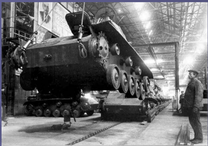
Сборка танков на Горьковском автозаводе