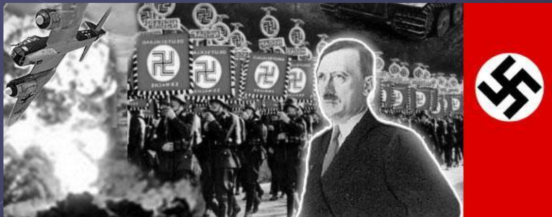
Адольф Гитлер – глава государства фашисткой Германии