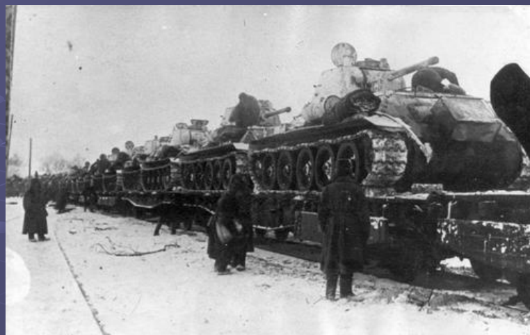
Отправка танков Т-34, выпущенных на заводе «Красное Сормово», на фронт.