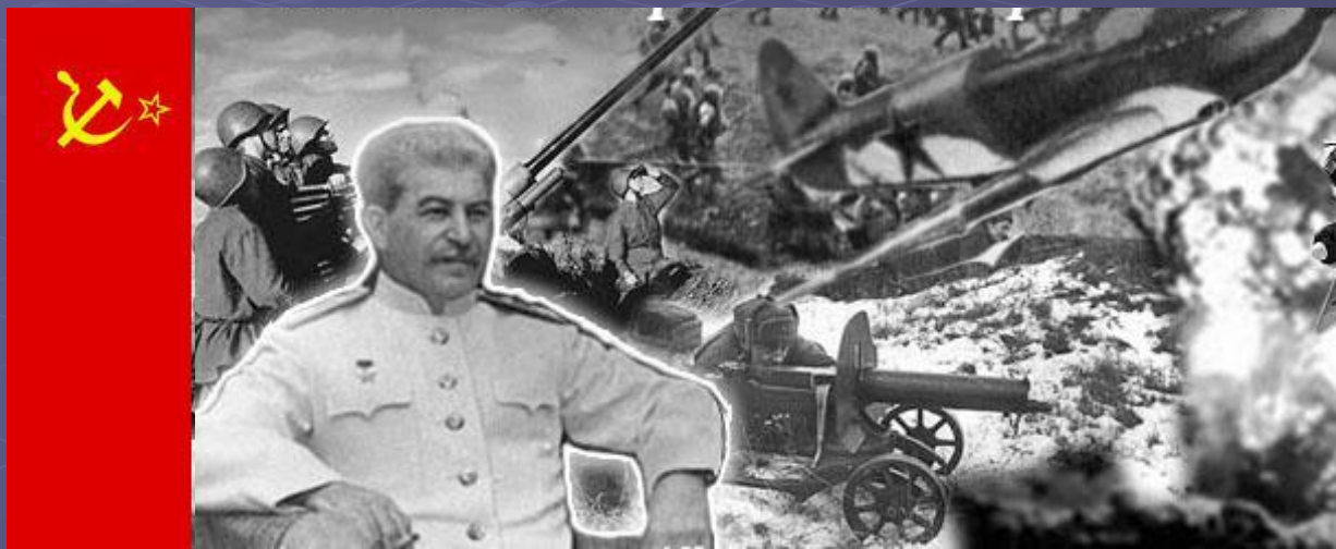
Иосиф Сталин – Председатель Совета Министров СССР