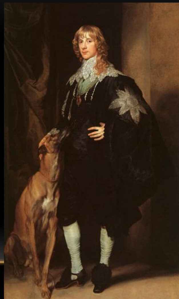
ДЖЕМС СТЮАРТ, ГЕРЦОГ РИЧМОНД И ЛЕННОКС. МУЗЕЙ МЕТРОПОЛИТЕН, НЬЮ-ЙОРК