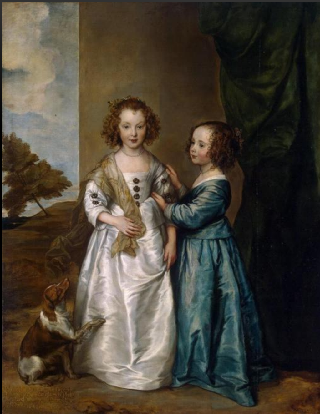
ПОРТРЕТ ФИЛАДЕЛЬФИИ И ЭЛИЗАБЕТ УОРТОН, 1640