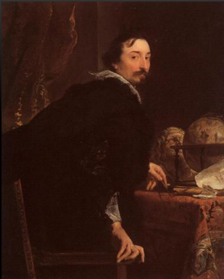
МУЖСКОЙ ПОРТРЕТ, 1622 МУЗЕЙ МЕТРОПОЛИТЕН, НЬЮ-ЙОРК