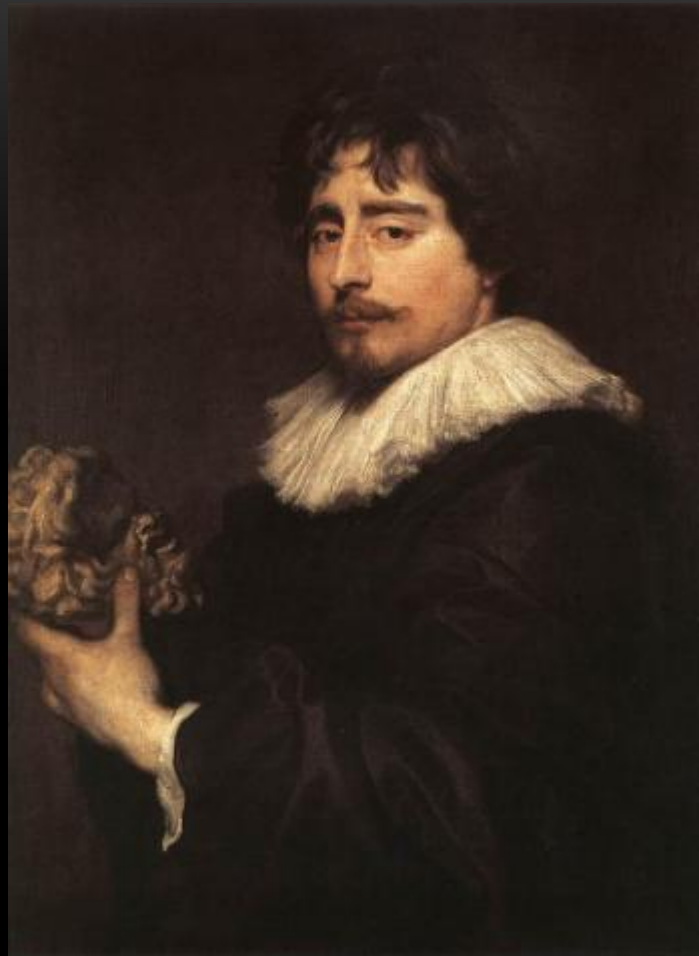
Портрет скульптора 1627-29 Брюссель