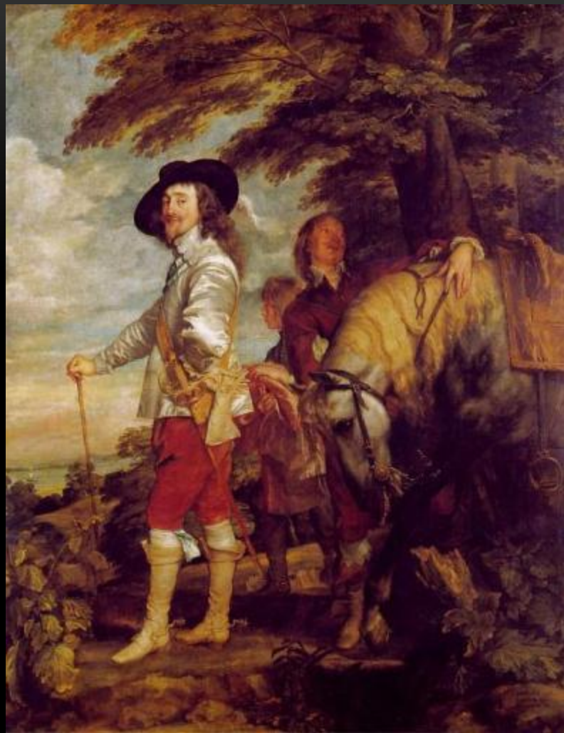
КАРЛ I, КОРОЛЬ АНГЛИИ НА ОХОТЕ, 1635 ЛУВР, ПАРИЖ