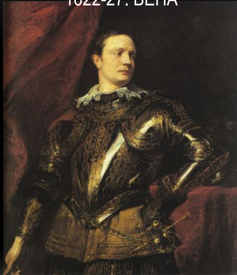
ПОРТРЕТ МОЛОДОГО ГЕНЕРАЛА, 1622-27. ВЕНА