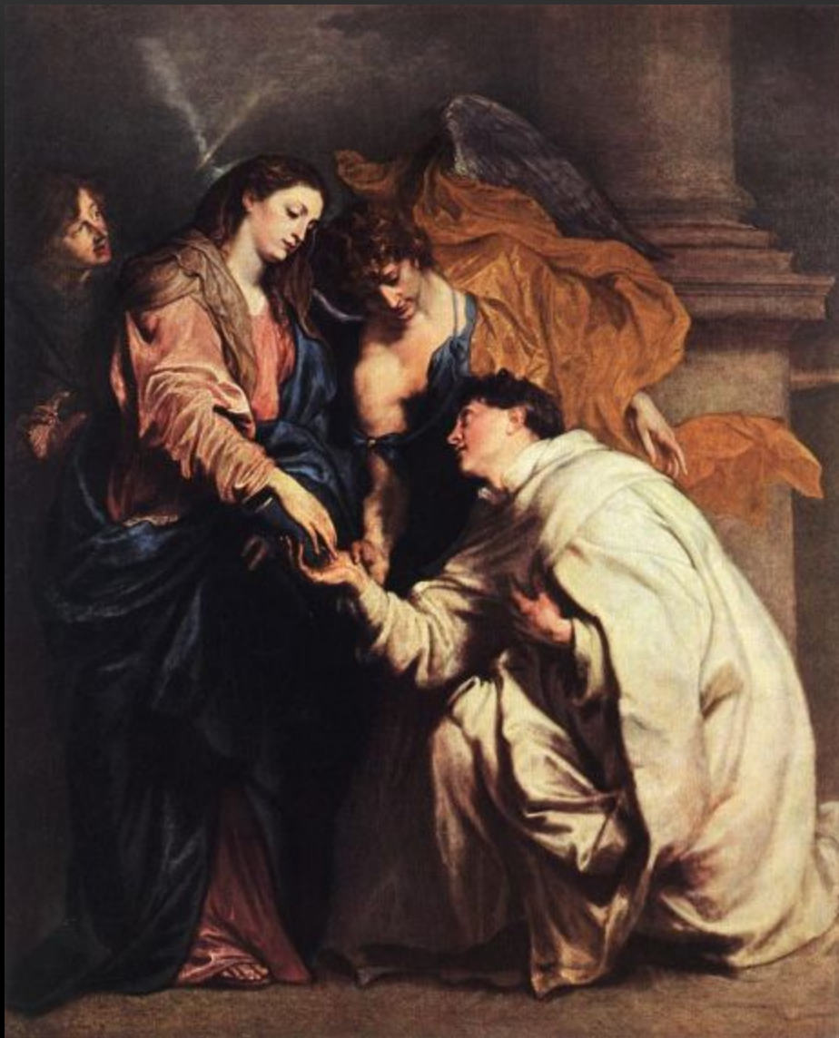
БЛАГОСЛОВЛЯЕМЫЙ ДЖОЗЕФ ХЕРМАНН, 1629 ВЕНА