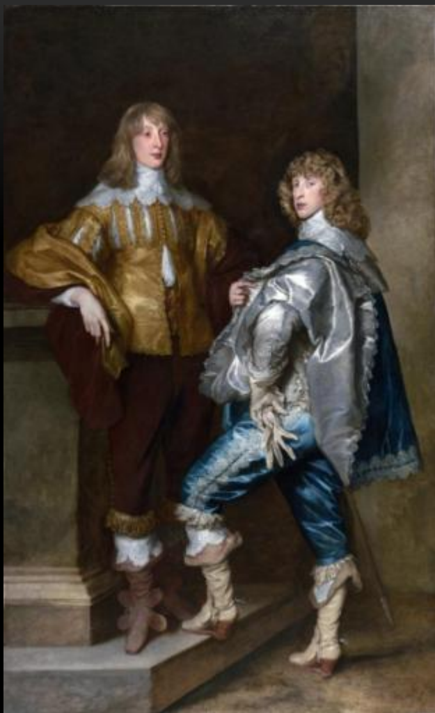
ЛОРД ДЖОН СТЮАРТ И ЕГО БРАТ ЛОРД БЕРНАРД СТЮАРТ