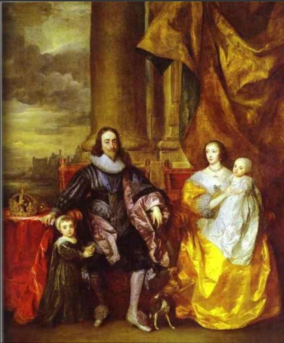
КАРЛ I И КОРОЛЕВА ГЕНРИЕТТА МАРИЯ, 1632