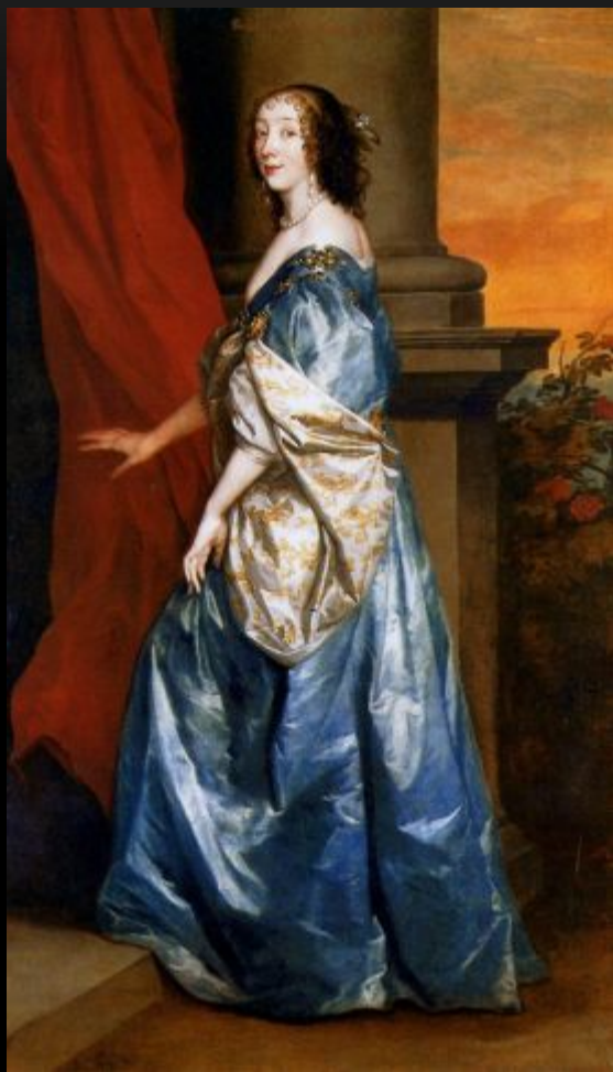
ЛЕДИ ЛЮСИ ПЕРСИ