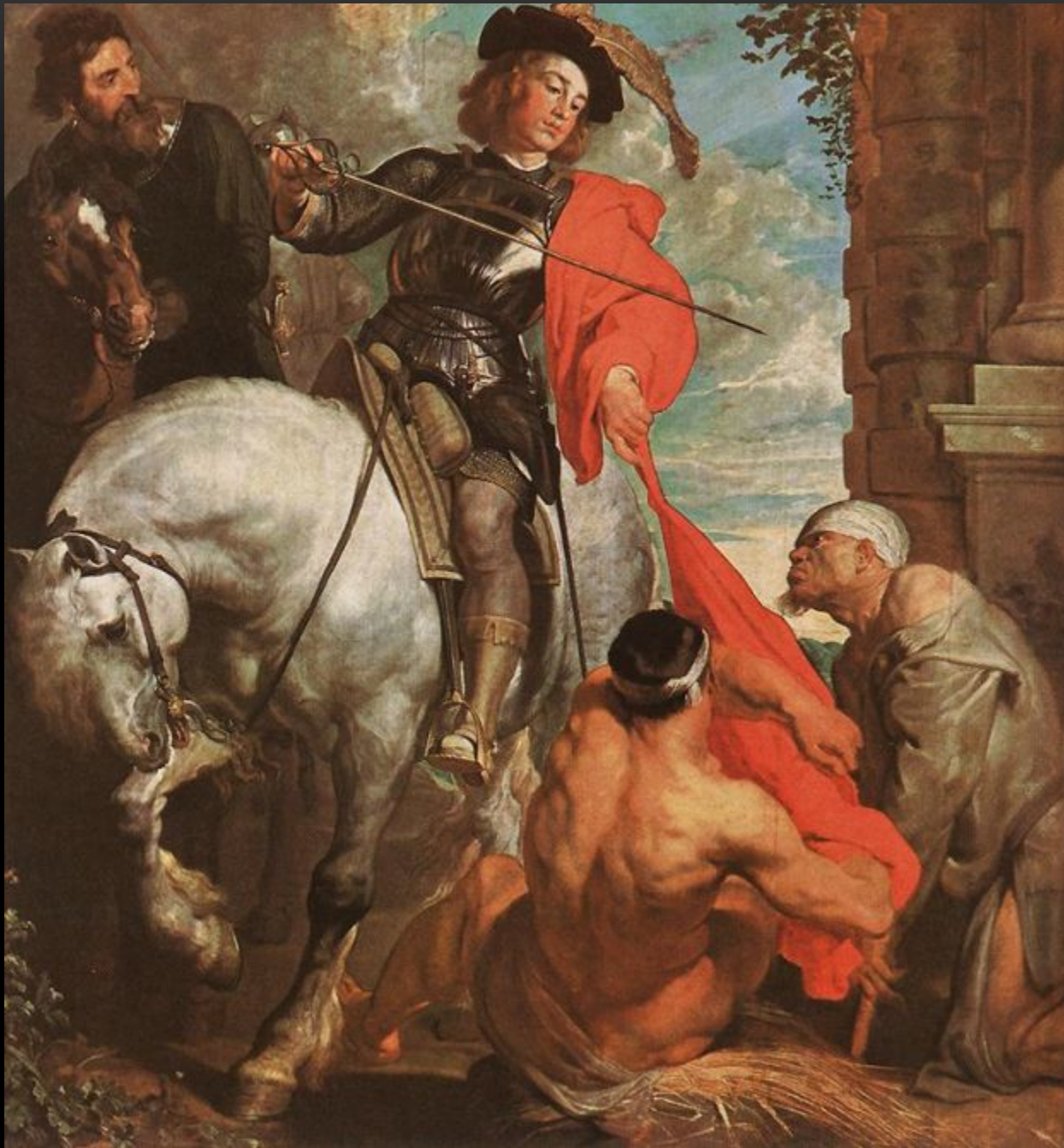
СВЯТОЙ МАРТИН, 1618