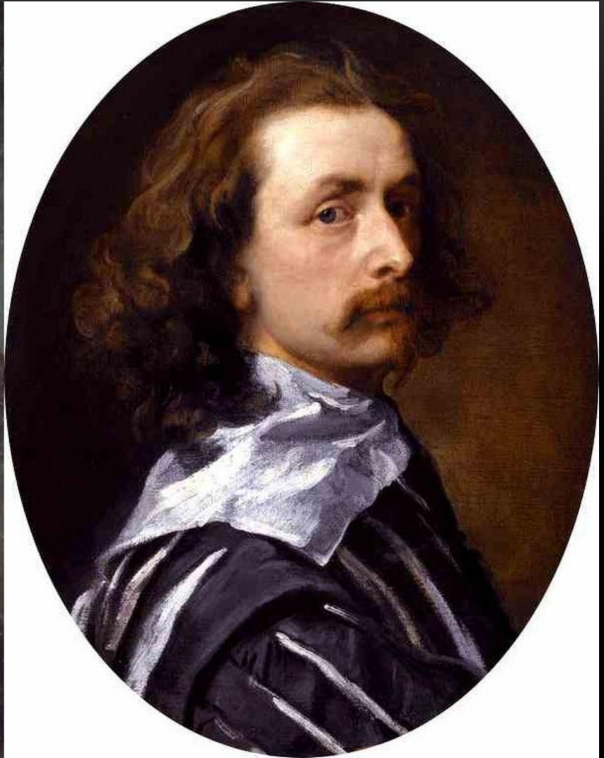
АНТОНИС ВАН ДЕЙК