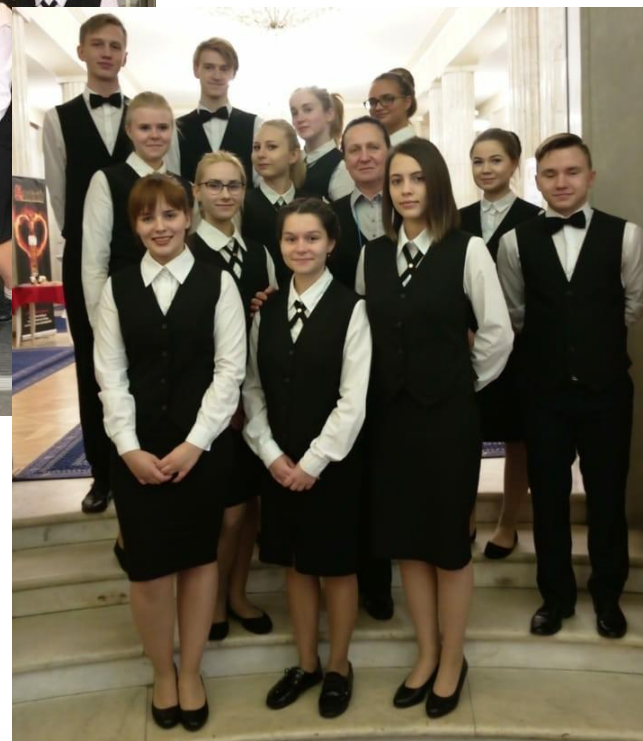
Обслуживание в посольстве Чехии