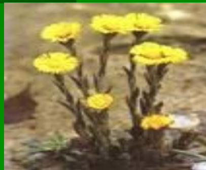
Мать –и – мачеха