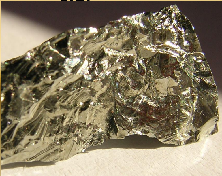
Руди рідкісних металів