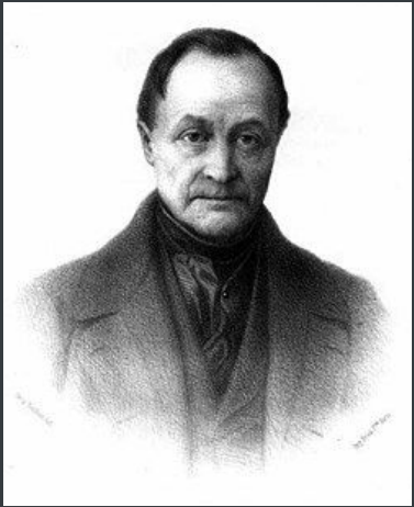
Огюст Конт (1798-1857)

француз философы, әлеуметтанушысы, философиядағы позитивизм мектебінің негізін қалаушы Еңбегі - «Позитивтік саясат жүйесі, немесе Адамзат діндері негіздері туралы социологиялық трактат»