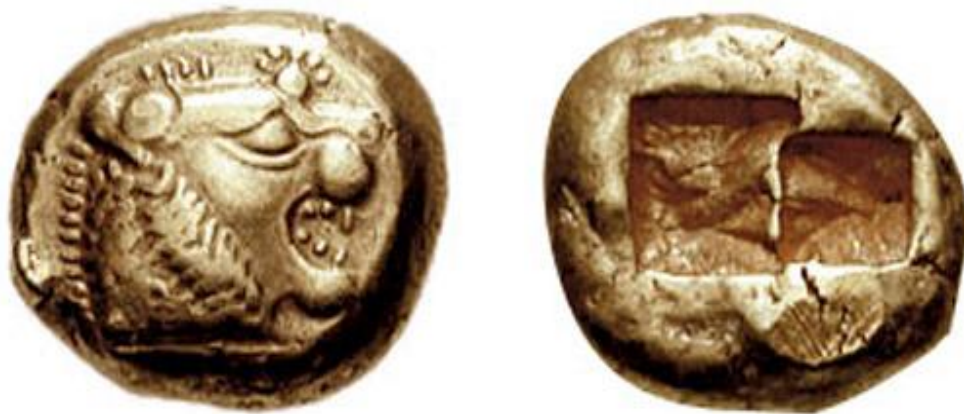
б.ғ.д VI ғасырлық Лидиялық мәнет. (трите, статердің үштен бірі)