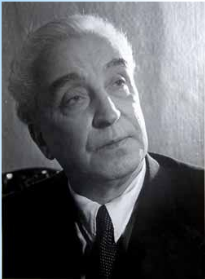
* Виноградов Виктор Владимирович (12.01.1895 - 4.10.1965)