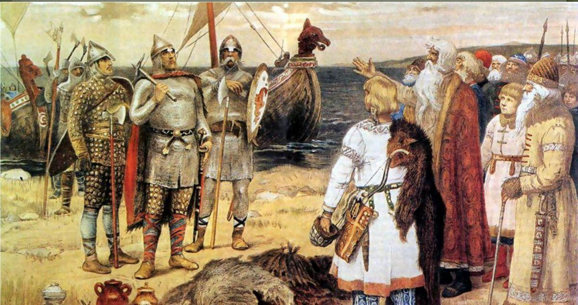
Варяги в гостях у восточных славян