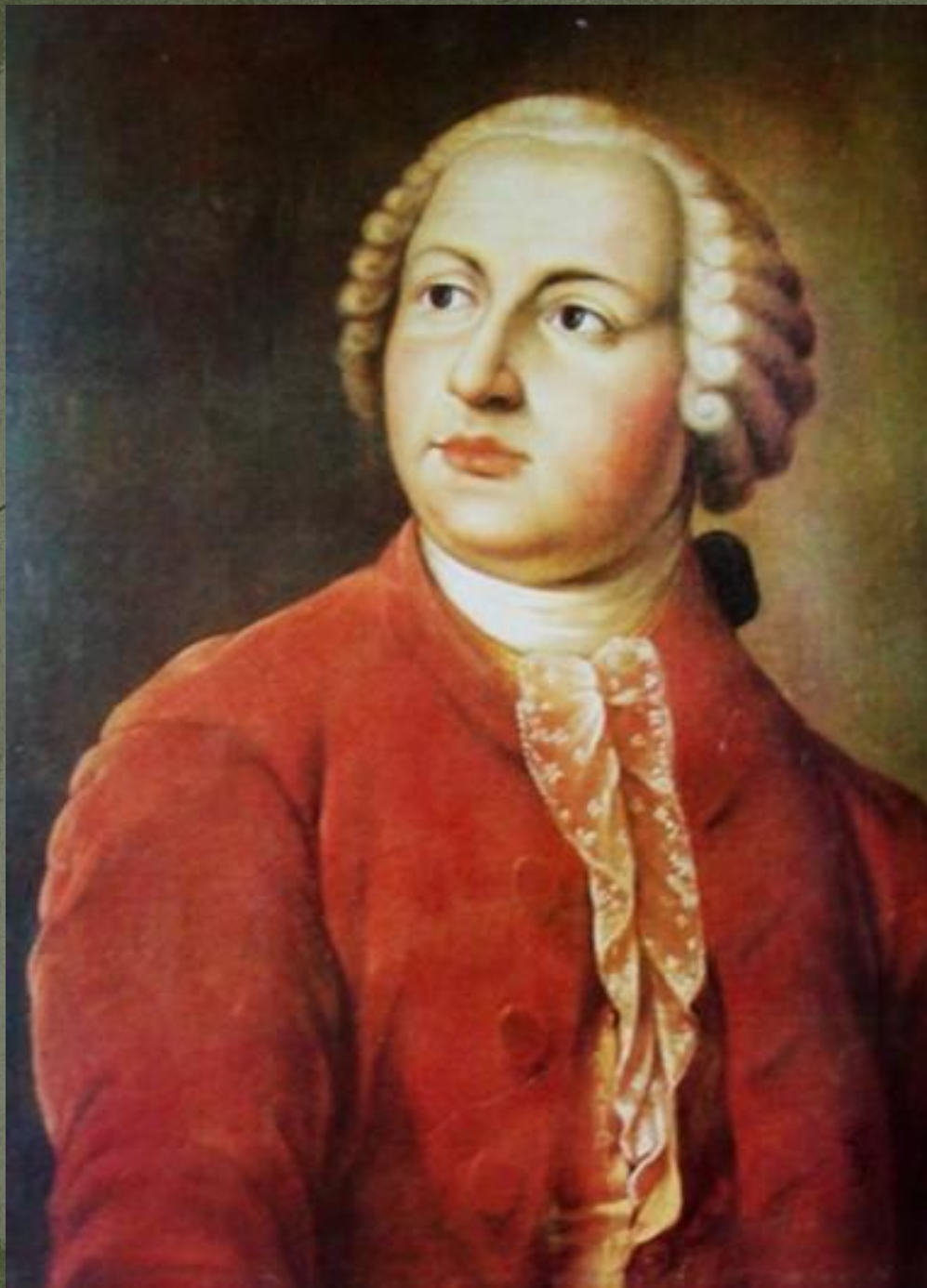
Михаил Васильевич Ломоносов (1711-1765)