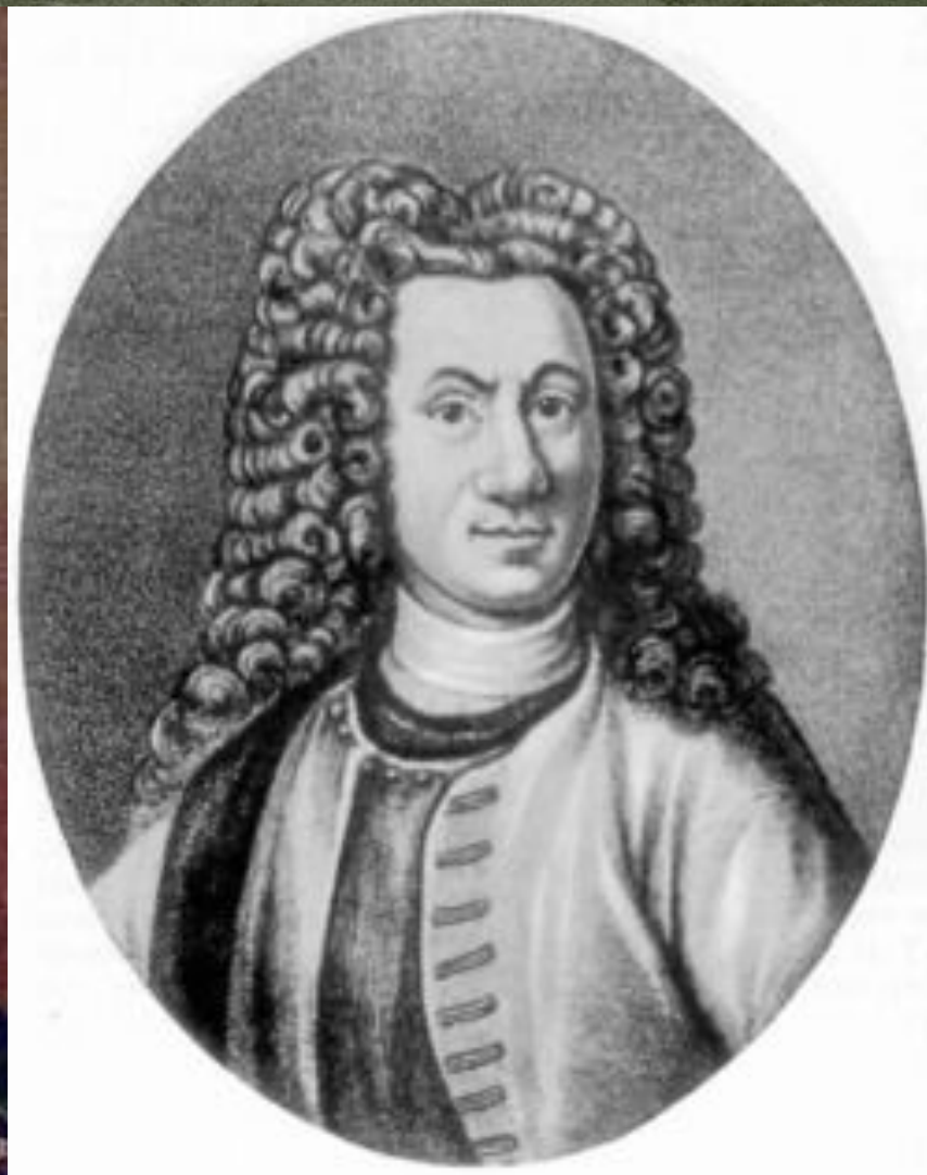
Герхард Фридрих Миллер (слева) и Готлиб Зигфрид Байер (сверху)