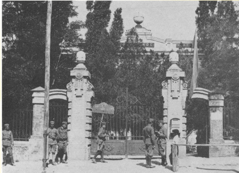
Бійці УСС на фоні міської думи Єлисаветграда в 1918 році

За задумом, сігові стрільці мали подавляти селянські повстання, які постійно спалахували на окупованій території, і забезпечувати армію хлібом. Проте посилаючи українських сігових стрільців відбирати хліб в українських селян, австро-угорська влада дуже помилилася