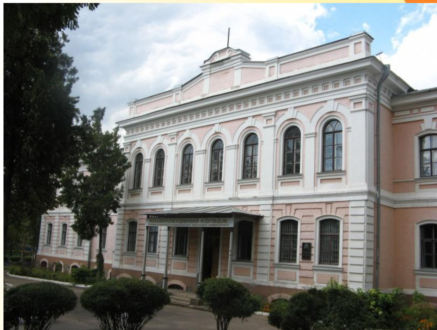
Будівля коледжу ЦНТУ

З 14-го червня 1918 року штаб підрозділу Легіону Українських Сізових стрільців розміщувався в приміщенні Єлисаветградського земського реального училища , де зараз знаходиться Кропивницький інженерний коледж ЦНТУ