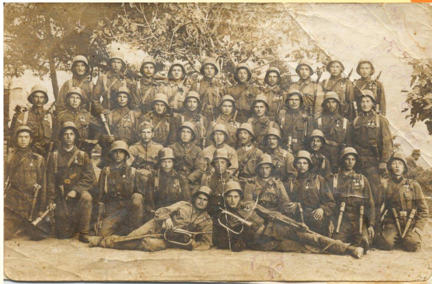
Штурмова бригада УСС

Українські сізові стрільці - українське національне військове формування, сформоване з добровольців 6 серпня 1914 року