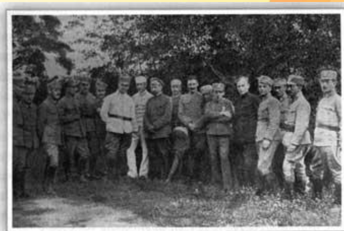
Старшини УСС в Грузькому