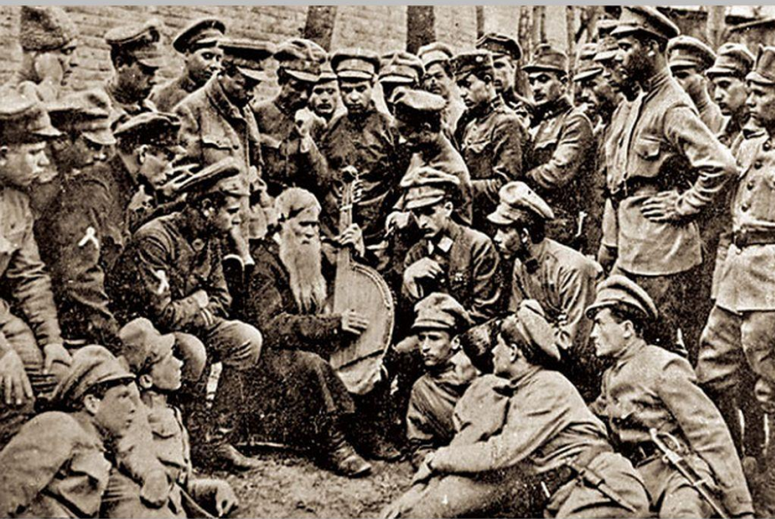
Невідомі Січові стрільці

Січові стрільці не стільки приборкували, скільки влаштовували святкові паради та театральні вистави, браталися з місцевим населенням