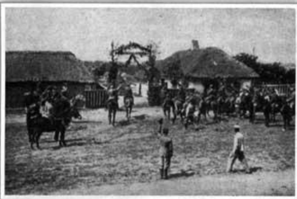
Стрілецьке весілля в Грузькому