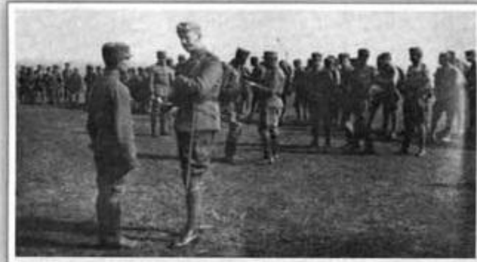
Гуцульська сотня УСС на площі вправ у Масляниківцях біля Єлисаветграду 1918 року.

В усіх споминах колишніх стрільців говориться про якнайприхильніше ставлення до них з боку місцевих українців, а також про загальний глибокий жаль, що супроводжував їх, коли вони виїздили.