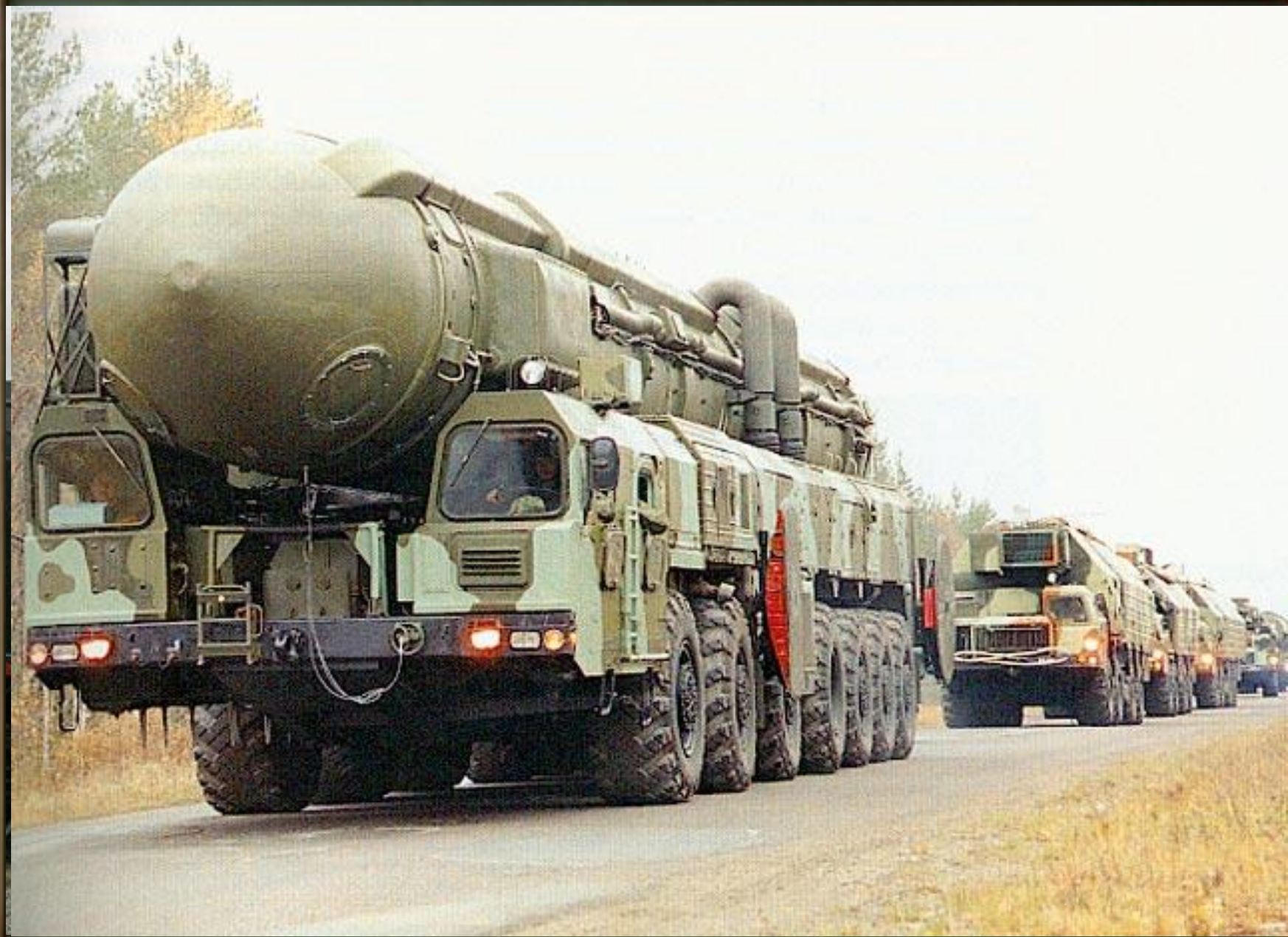
МБР РТ-2ПМ «Тополь».