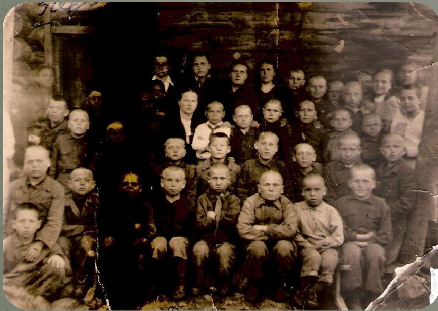
Воспитанники Завьяловского детского дома 1943г.

Голодных умирающих детей. Фотографий, воспоминаний о Бутаковском детском доме в годы войны нет. О детях ленинградцах, которые проживали в с. Завьялово свидетельствуют эти снимки: