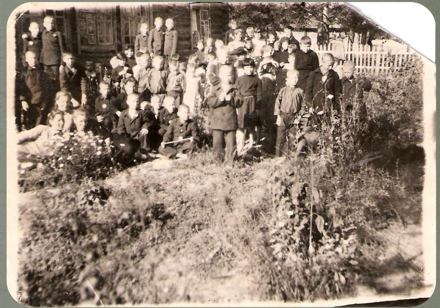
Дети блокадного Ленинграда 1943г. Завьялово