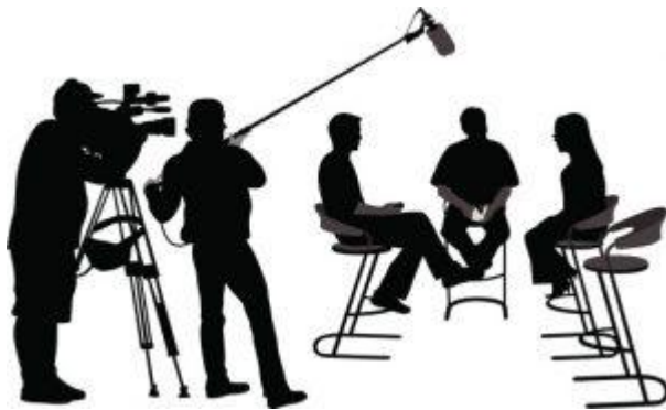
Средства массовой информации