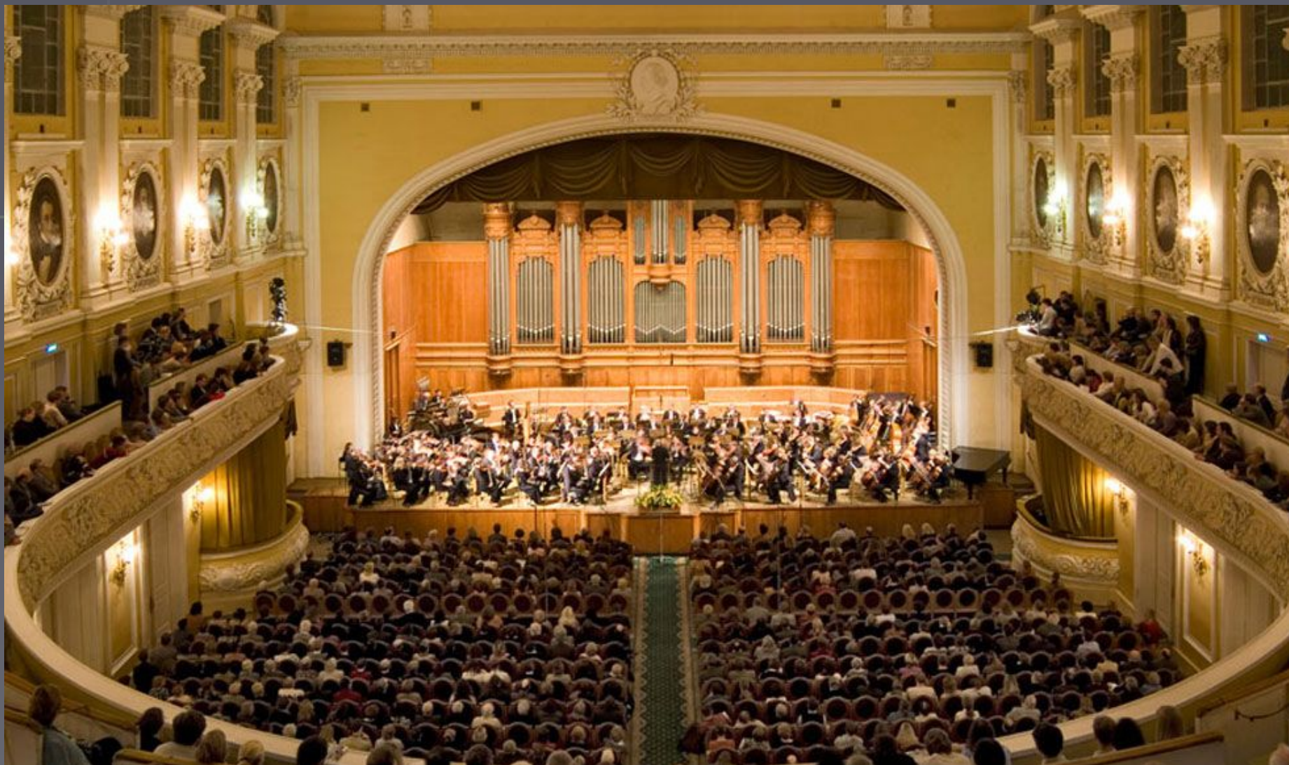
Большой зал Московской консерватории