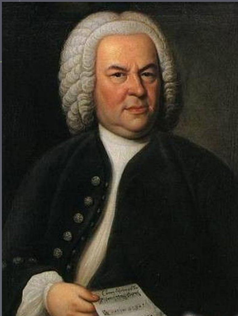
Иоганн Себастьян Бах. Скерцо (шутка)