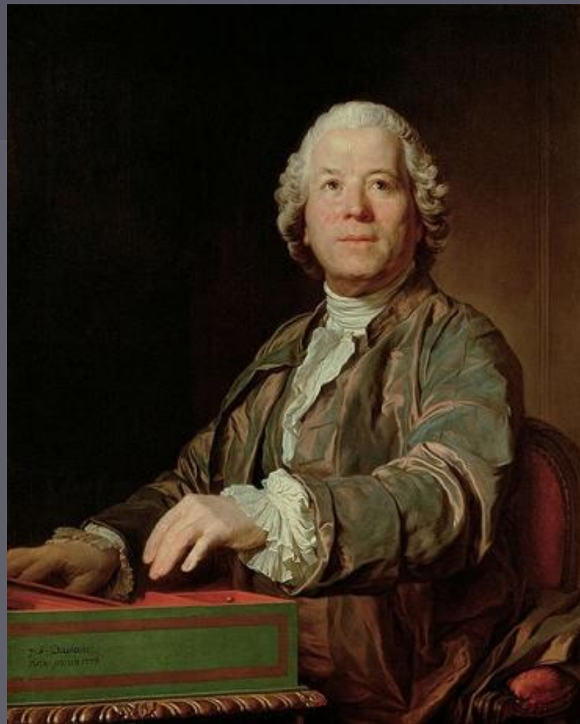
Кристоф Виллибальд Глюк Мелодия для флейты