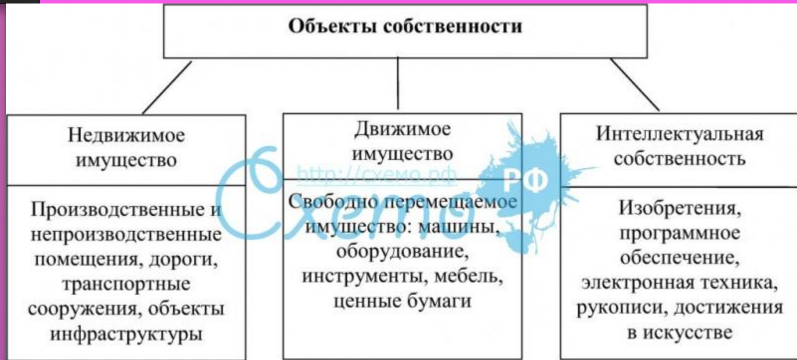
Рис. 2.7. Объекты собственности

•Объектом собственности является организационно-обособленная часть национального богатства, юридически закрепленная за конкретным собственником или группой собственников.