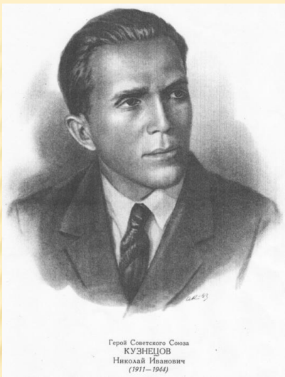
Герой Советского Союза КУЗНЕЦОВ Николай Иванович (1911–1944)

Веселость, остроумность, щедрость, обаяние позволили Н. И. Кузнецову в короткое время подчинять своему влиянию многих немецких офицеров, от которых он часто получал сообщения одно интереснее другого.