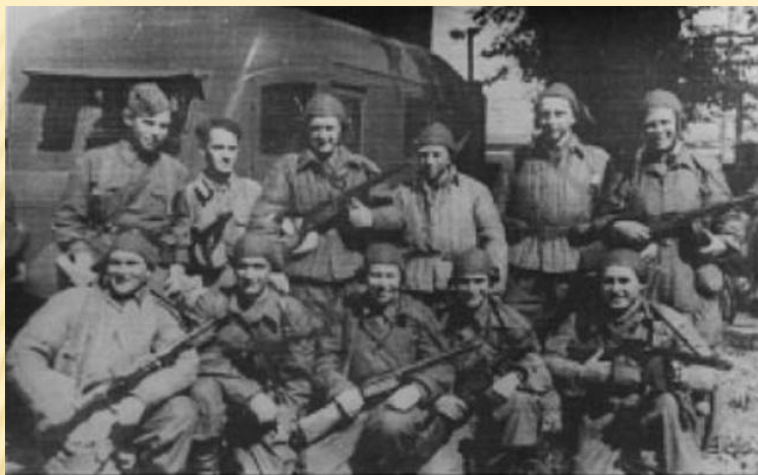
Группа бойцов отряда "Победители" перед выбросом в немецкий тыл.

Разведывательную деятельность Николай Иванович Кузнецов вел в оккупированном немцами г. Ровно, передавая сведения в партизанский отряд. Ему удалось узнать о подготовке фашистами наступления на Курской дуге. Он убил имперского советника генерала Геля, похитил командующего карательными войсками на Украине генерала фон Ильгена, вместе с боевыми товарищами совершал диверсии