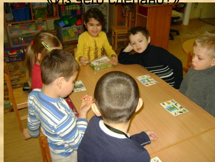
«Из чего сделано?»