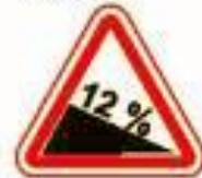
1.13 Крутой спуск