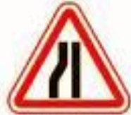
1.20.3 Сужение дороги