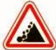
1.28 Падение камней