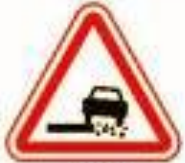
1.19 Опасная обочина