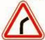
1.11.1 Опасный поворот