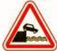
1.10 Выезд на набережную