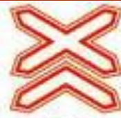
1.3.2 Многопутная железная дорога