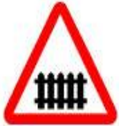
1.1 Железнодорожный переезд со шлагбаумом