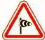
1.29 Боковой ветер