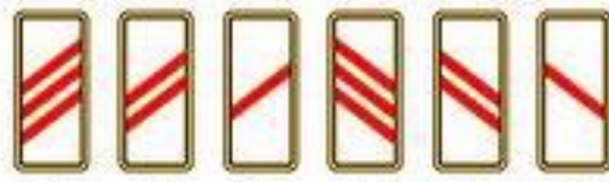
1.4.1 1.4.2 1.4.3 1.4.4 1.4.5 1.4.6 Приближение к железнодорожному переезду