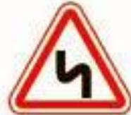
1.12.2 Опасные повороты