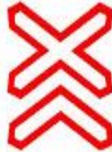
Знак 1.32 Многопутная железная дорога.

Таким знаком обозначают каждый переезд, не оборудованный шлагбаумами. В этом случае вместо шлагбаумов с обеих сторон переезда будут стоять знаки, информирующие водителей о том, предстоит ли им пересечь только одни железнодорожные пути или несколько. Обозначают границы переезда.