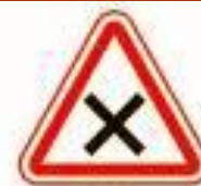
1.6 Пересечение равнозначных дорог