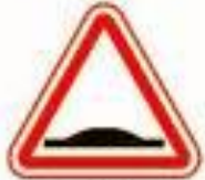
1.17 Искусственная неровность