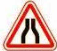
1.20.1 Сужение дороги