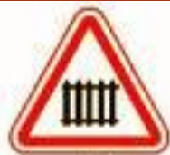
1.1 Железнодорожный переезд со шлагбаумом