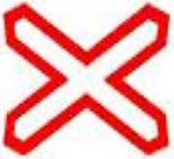
Знак 1.31. Однопутная железная дорога.