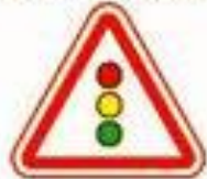
1.8 Светофорное регулирование