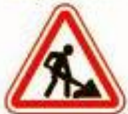
1.25 Дорожные работы