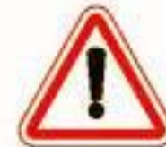
1.33 Прочие опасности