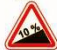
1.14 Крутой подъем