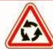
1.7 Пересечение с круговым движением