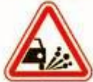
1.18 Выброс гравия