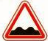
1.16 Неровная дорога