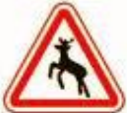
1.27 Дикие животные