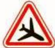
1.30 Низколетящие самолеты