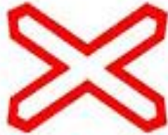
1.3.1 Однопутная железная дорога