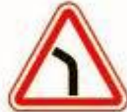
1.11.2 Опасный поворот