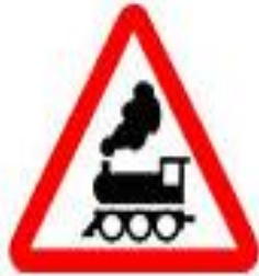
1.2 Железнодорожный переезд без шлагбаума