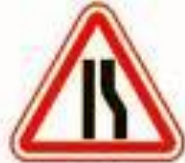
1.20.2 Сужение дороги