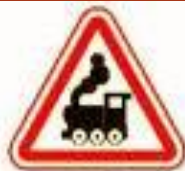
1.2 Железнодорожный переезд без шлагбаума