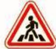
1.22 Пешеходный переход