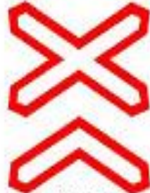
1.3.2 Многопутная железная дорога