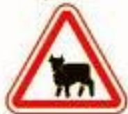
1.26 Перегон скота