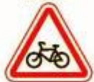
1.24 Пересечение с велосипедной дорожкой