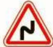
1.12.1 Опасные повороты