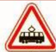
1.5 Пересечение с трамвайной линией