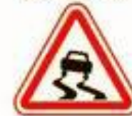
1.15 Скользящая дорога