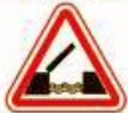
1.9 Разводной мост