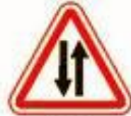
1.21 Двустороннее движение