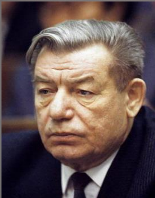
Колбин Геннадий Васильевич (1927-1998 ж.)

18 желтоқсан болып өткен Қазақстан Коммунистік партиясы Орталық Комитетінің кезектен тыс Пленумы республиканы ширек ғасырға жуық уақыт басқарған Д.А.Қонаевты қызметінен босатып, оның орнына сол уақытқа дейін Ресей Федерациясында Ульянов облыстық партия ұйымын басқарған Г.В. Колбин сайланды.