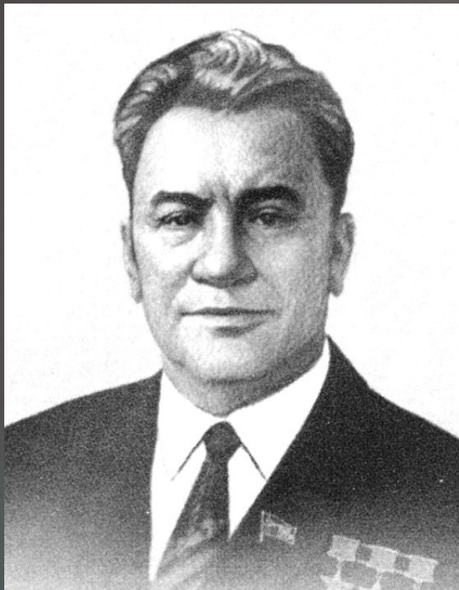
Дінмұхамед Ахметұлы Қонаев (1912-1993 ж.)