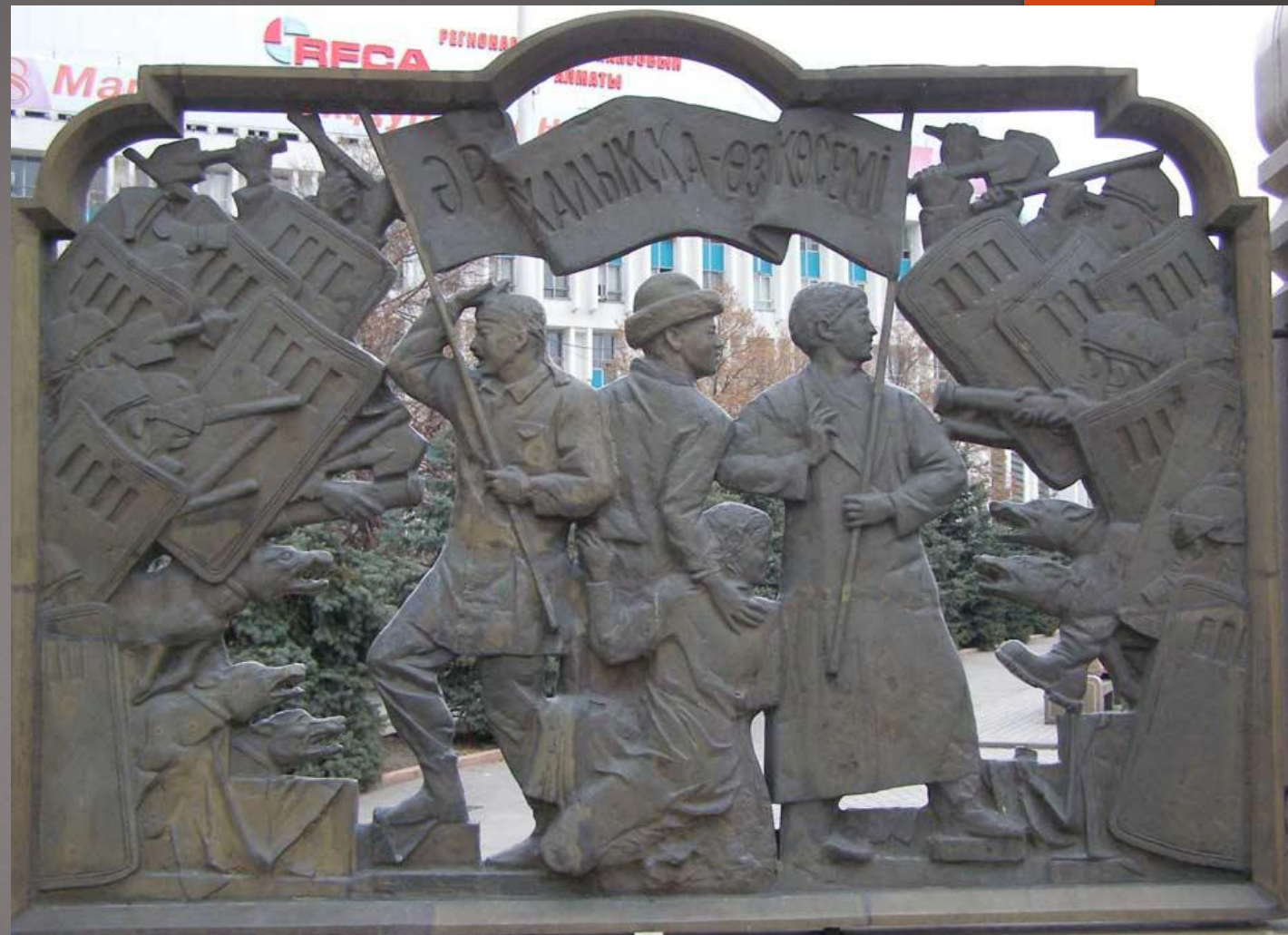
Желтоқсан оқиғаларына арналған Қазақстан Республикасының Тәуелсіздік монументі