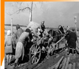
* Сельское хозяйство в годы войны

Материальный ущерб, причиненный фашистами жителям села Хохол огромный. Он составляет миллионы рублей. За время оккупации фашисты уничтожили в селе Хохол Дом культуры, редакцию районной газеты и типографию, школы, медицинский пункт и больницу, две библиотеки, скотные дворы, всю живность. На каторжные работы угнаны сотни юношей и девушек. По переписи от февраля 1943 года дворов оказалось всего 7337 (7032 колхозников, 176 хозяйств рабочих и служащих, 416 единоличных дворов и 213 дворов временно проживающих). Численность населения была небольшой - всего 30 282 человека (из них 11 142 мужчины и 19 140 женщины). поголовье колхозного стада было катастрофически низким: лошадей — 657 голов, крупного рогатого скота — 206 голов. В индивидуальном хозяйстве колхозников дела обстояли значительно лучше: крупного рогатого скота было — 4852 головы, из них коров — 4045 головы, овец - 2584 головы; коз - 1964 головы. Промышленность, колхозное производство, социальная сфера села Хохол — были разрушены. Война явилась суровой проверкой силы и жизнестойкости людей в тылу. Но труженики колхоза, подсобного хозяйства, артели, женщины и подростки, выдержали ее с честью. Своим трудом они обеспечивали и снабжали Красную Армию продовольствием, повозками и тем самым помогли приблизить победу и разгромить фашистских захватчиков.