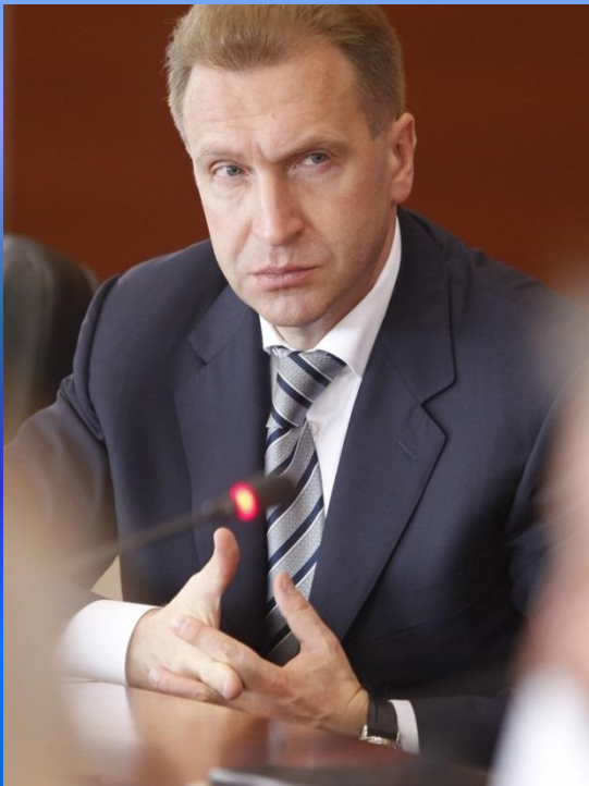
Шувалов Игорь Иванович Кедендік одақ комиссиясының Төрағасы - Ресей Федерациясы Үкіметі Төрағасының бірінші орынбасары

Беларусь Республикасы, Қазақстан Республикасы және Ресей Федерациясы 2007 жылдың 6 қазанындағы Келісім-шартына сәйкес кедендік одақтың әрдайым қызмет атқаратын біріңғай реттеу органы – Кедендік комиссия құрды. Кедендік одақ комиссиясы процедурасының ережелері, Кедендік одақ комиссиясы қызметінің заңдық негізі болып табылады.