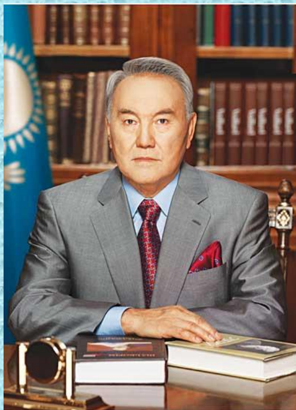
Қазақстан Республикасының Президенті Нұрсұлтан Әбішұлы Назарбаев