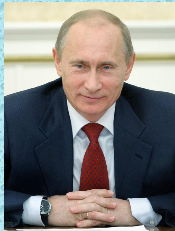
Ресей Федерациясының Владимир Владимирович Путин