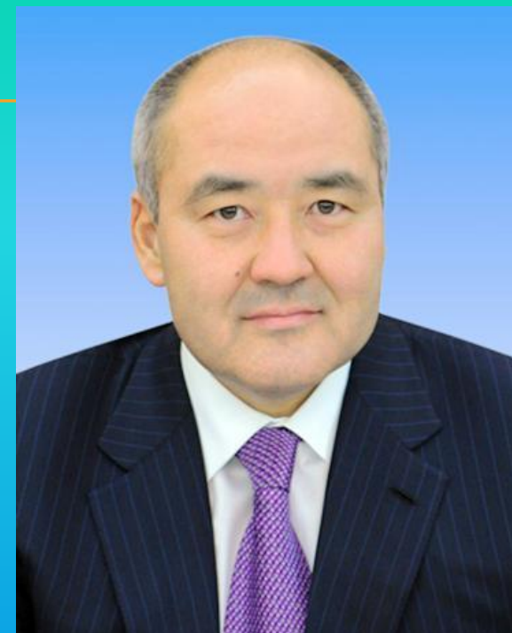
Шөкеев Өмірзақ Естайұлы Қазақстан Республикасы Үкіметі Төрағасының бірінші орынбасары

2009 жылдың 22 сәуір айынан бастап Қазақстан Республикасының