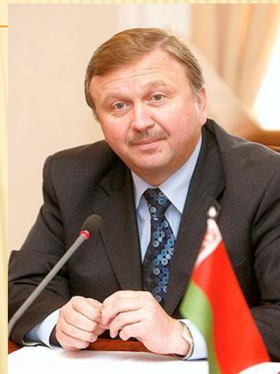
Кобяков Андрей Владимирович Беларусь Республикасы Үкіметі Төрағасының орынбасары

1960 жылы Мәскеу (Ресей) қаласында дүниеге келді. Мәскеу авиациялық институтын, Беларусь мемлекеттік ауыл шаруашылығы институтын және БКП саясаттану және әлеуметтік басқару институтын оқып бітірді. Еңбек қызметін Минск қаласындағы С.И. Вавилов атындағы механикалық зауыттың механикалық құрастыру цехінің шебері ретінде бастады. 1988-1989 жылдары Рогачев қаласындағы «Диaproектор» зауытында, 1988-1989 жылдары – БКП Рогачев қалалық комитетінің нұсқаушысы болып жұмыс істеді. 1991-1995 жылдары – «Диaproектор» зауытының жоспарлы экономикалық бөлім басшысы, экономика жөніндегі директордың орынбасары. 1995-1996 жылдары – Беларусь Республикасы Президентінің бақылау Қызметі басшысының орынбасары. 1996-1998 жылдары – Беларусь Республикасы мемлекеттік бақылау Комитеті төрағасының орынбасары. 1998 жылдың маусымынан бастап – жеңіл өнеркәсіп тауарларын өндіру және сату жөніндегі Беларусь концернінің президенті. 1998-2000 жылдары – мемлекеттік бақылау Комитетінің төрағасы. 2000 жылдан бастап – премьер-министрдің бірінші орынбасары, 2001 жылдан бастап – Беларусь Республикасы премьер-министрінің орынбасары. 2002 жылдан бастап – Беларусь Республикасы премьер-министрінің орынбасары – Беларусь Республикасының экономика министрі. 2003 жылдың желтоқсанынан бастап – Беларусь Республикасы Үкіметі Төрағасының орынбасары.