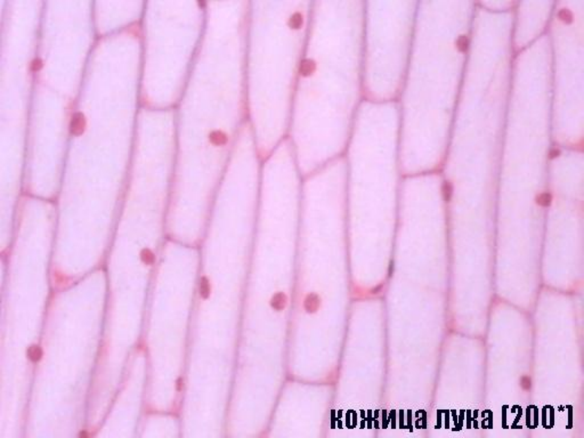
кожица лука (200*)