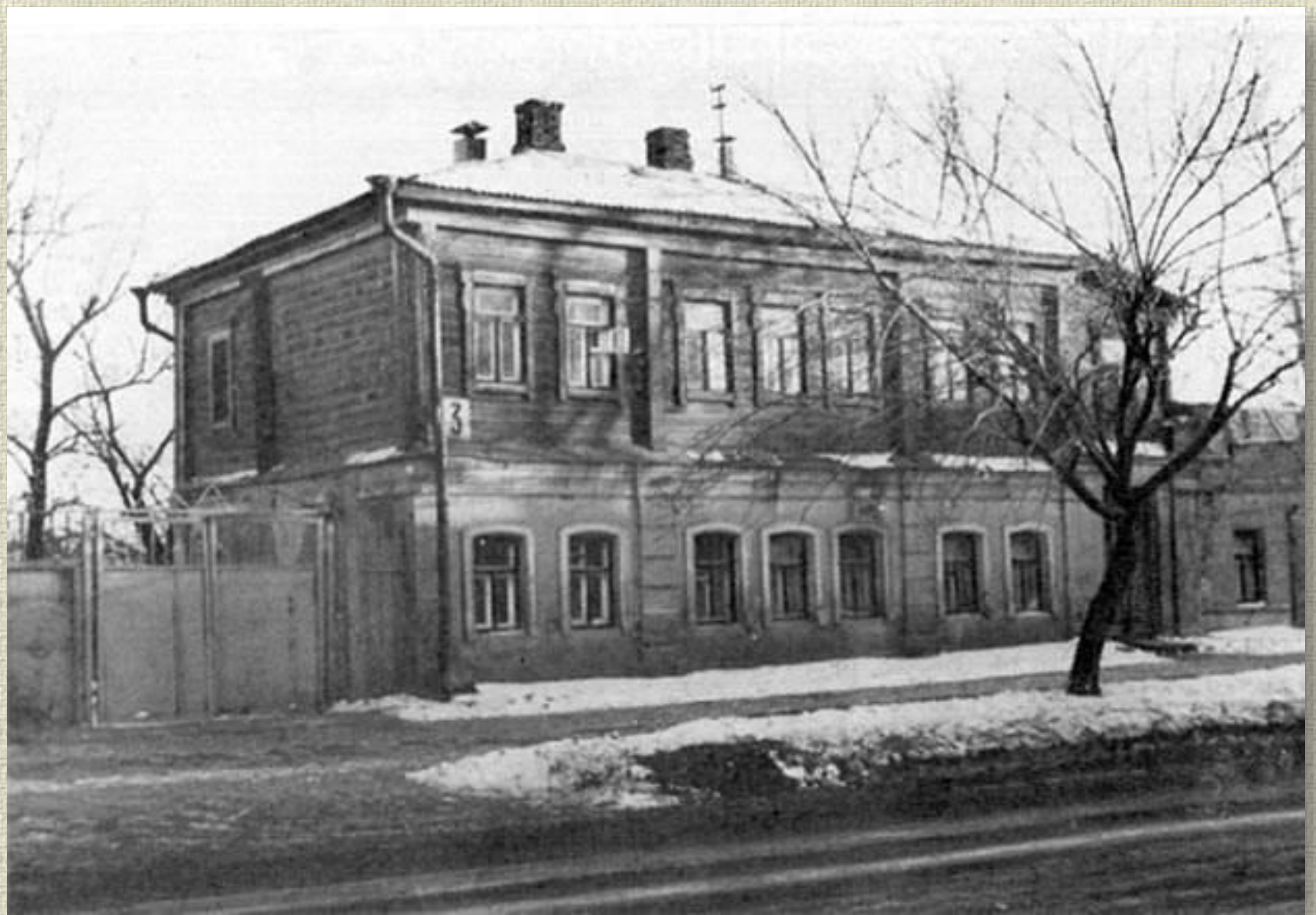
Воронеж. Дом, в котором родился И.А. Бунин