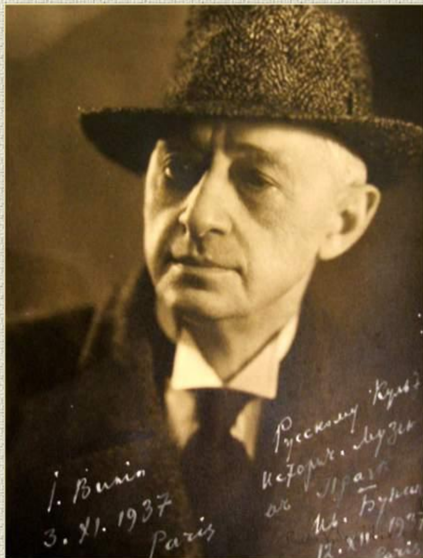
И.А.Бунин в эмиграции

«Все мы Россию, наше русское естество унесли с собою, и где бы мы ни были, она в нас, в наших мыслях и чувствах», – писал Бунин. Чувство Родины особенно сильно проявилось во время войны с гитлеровской Германией. Он не отходил от радио, чтобы узнать правду о продвижении советских войск, а потом записывал услышанное в дневнике