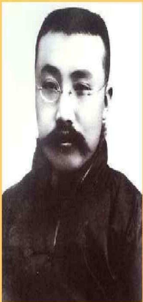
• Чэнь Дусю