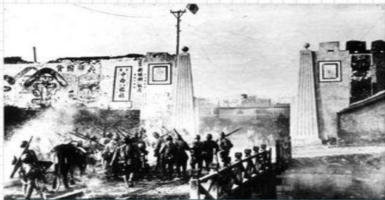
Японо – Китайская война ( 1939 – 1945 гг.)