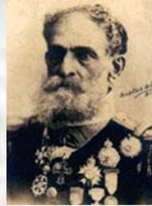
Деодоро да Фонсека