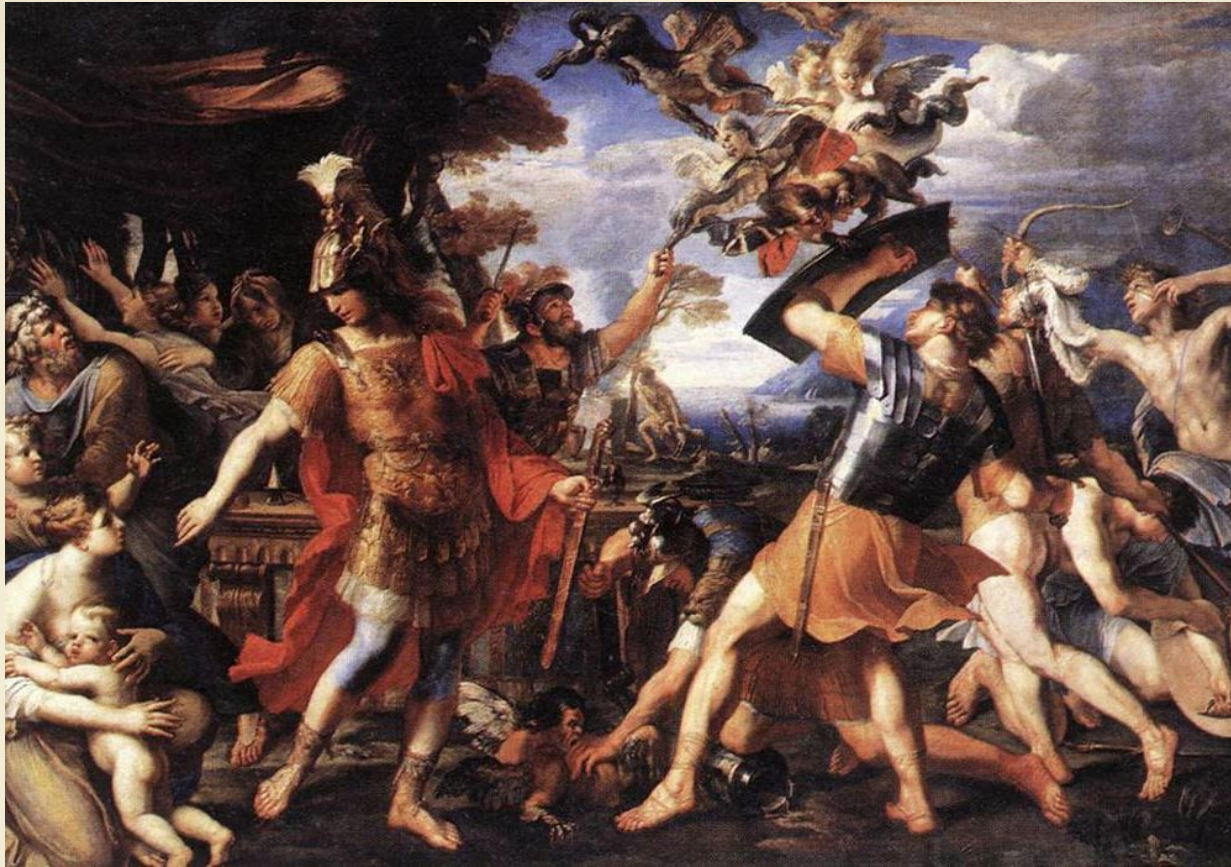
Битва Енея з гарпіями