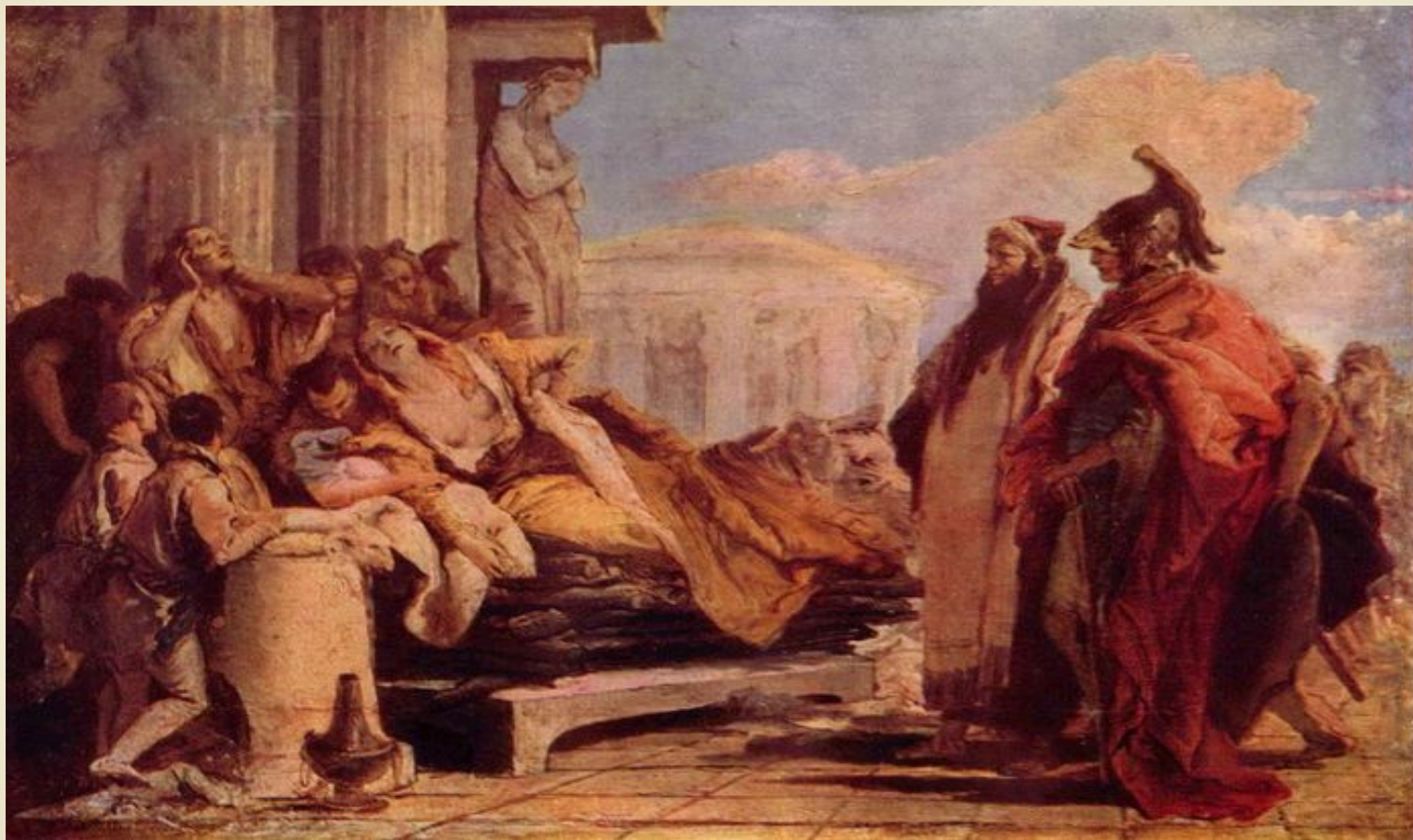
Смерть Дідони Італійська фреска ілюстрація до “Енеїди” Еней представляє Дідоні Купідона Тьєполо