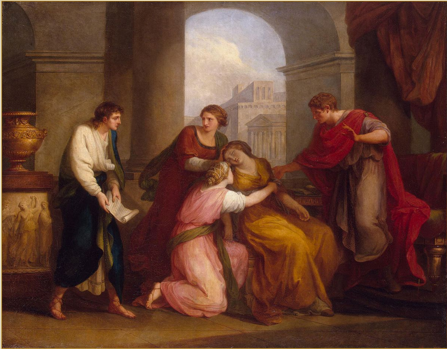
Анжеліка Кауфман “Вергілій читає “Енеїду” Октавії і Августу”