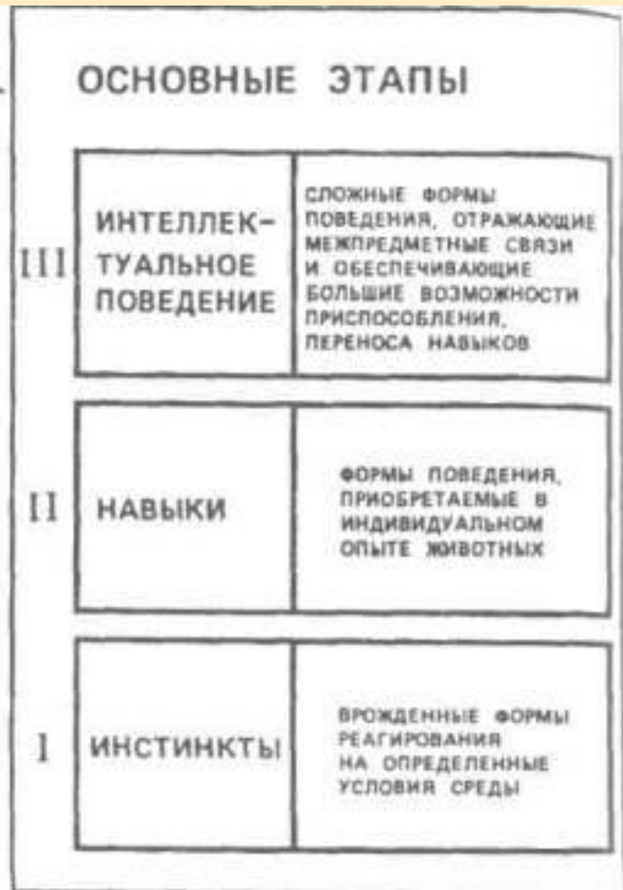
Рис. III.8. Развитие форм поведения в филогенезе