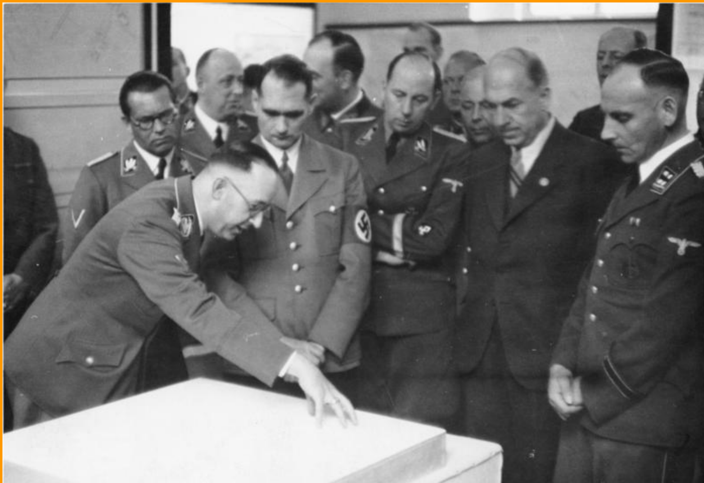
Bundesarchiv, R 49 Bild-0023 Foto: Zeymer | 1941 ca.