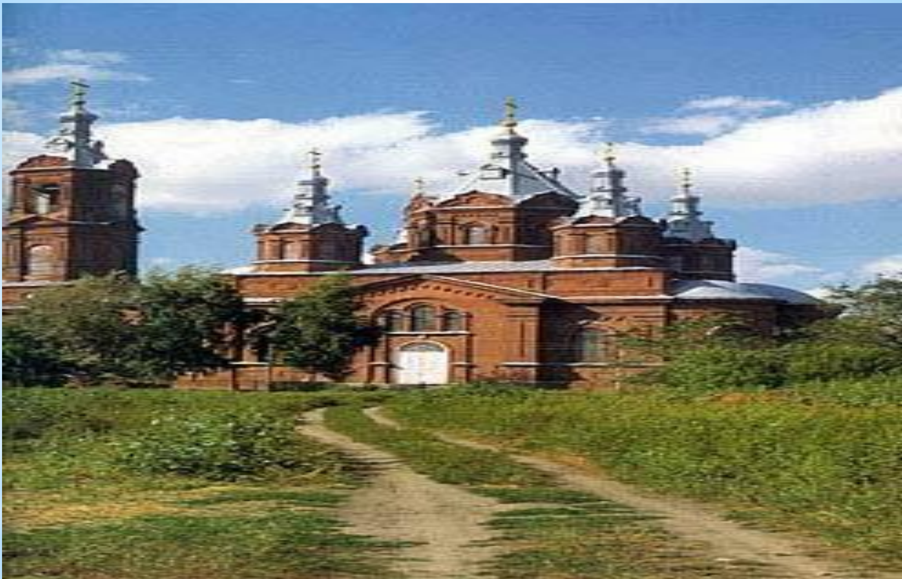
Михайло-Архангельский собор, п.Мордово