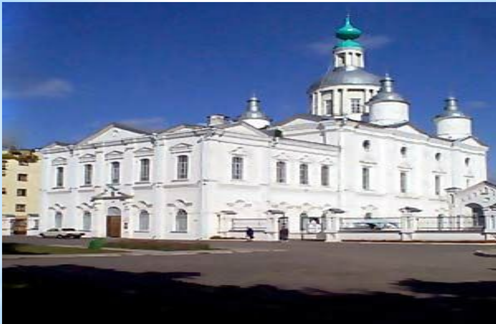
Спасо - Преображенский собор, г.Тамбов.