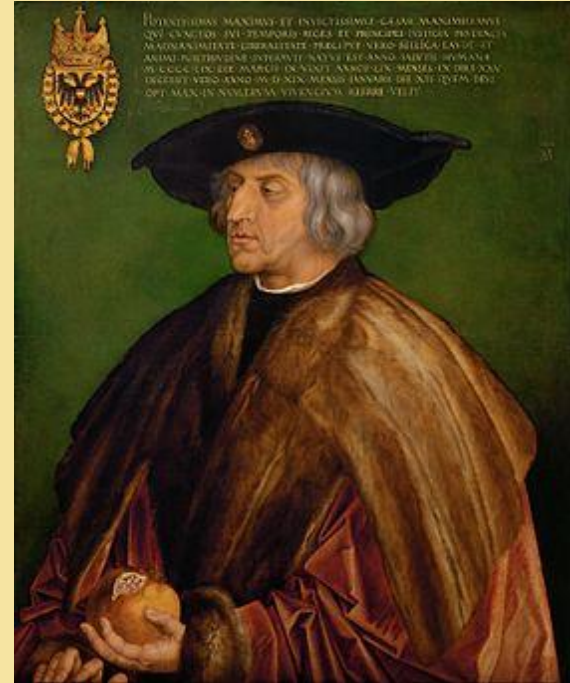
Максимилиан I – император Священной Римской империи

Задание: выясните, почему переговоры о союзе России и Священной Римской империи закончились провалом.