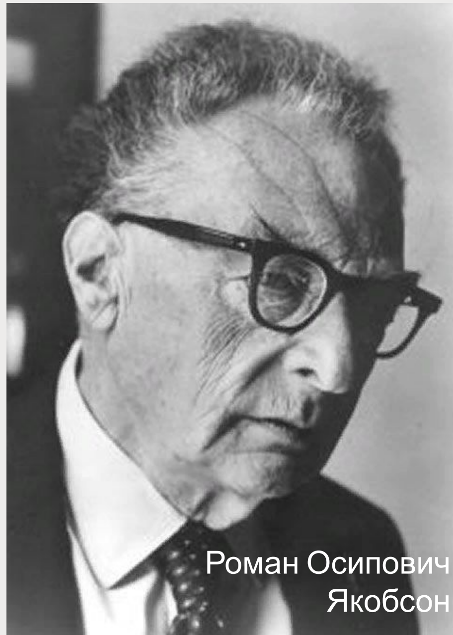
Роман Осипович Якобсон