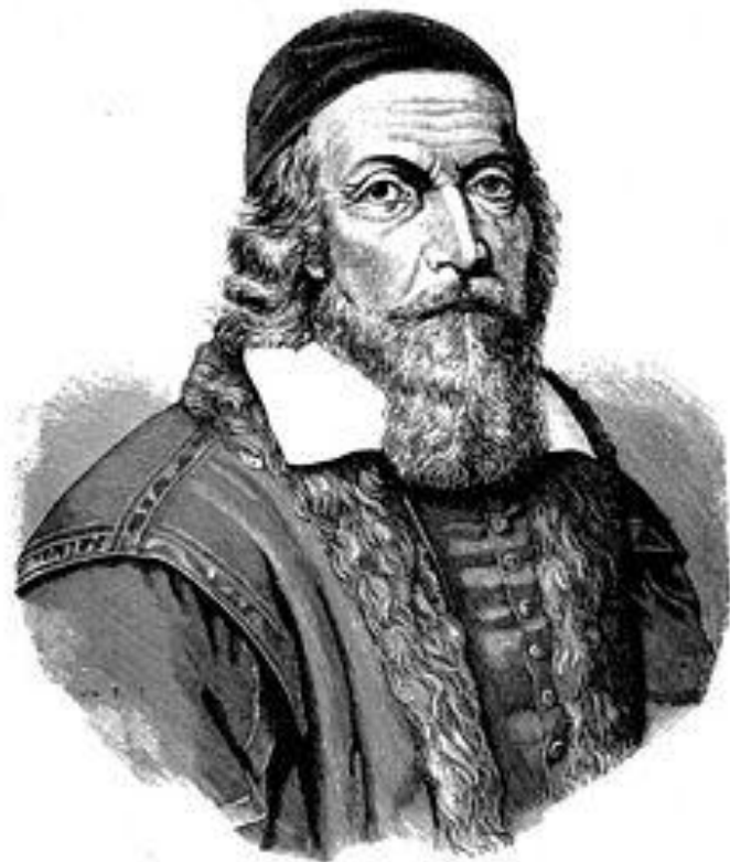
Ян Амос Коменский

Читать и не понимать – то же, что совсем не читать