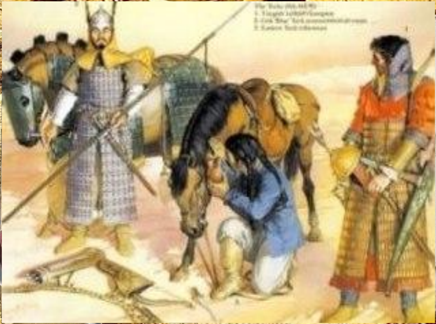
The Battle of Hattin 1. English knight on horse 2. Arab "dog" Arab warrior on horse 3. Arab warrior on horse