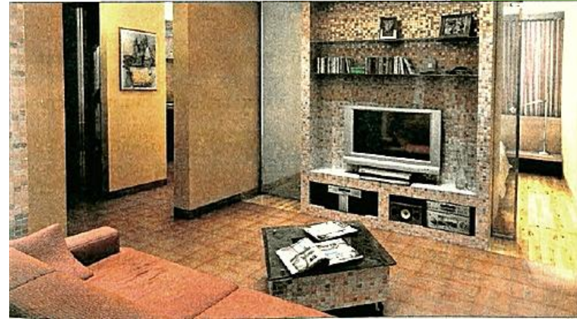
Пример интерьера гостиной