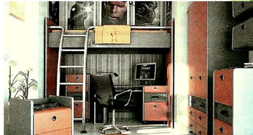
Пример интерьера комнаты подростка