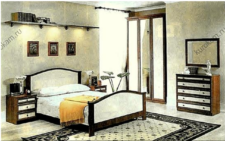
Пример интерьера спальни