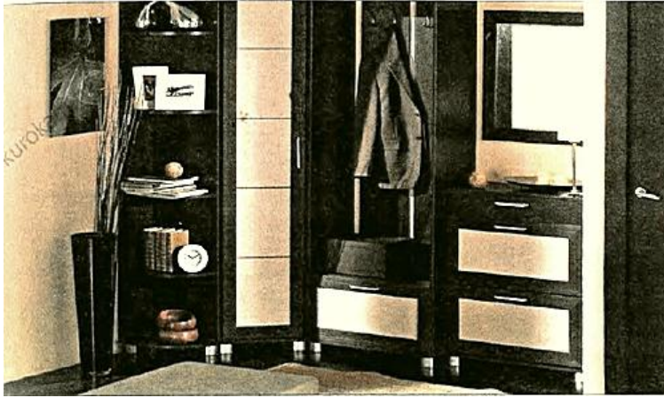
Пример интерьера прихожей