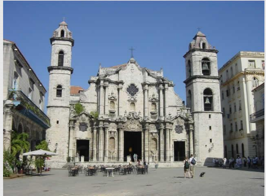
Кафедральний собор св. Христофора Гавана

У Республіці Куба переважна більшість віруючих -- римські католики. Серед протестантів є прихильники Протестантської єпископальної церкви (12 тис.), баптисти (30 тис.), методисти (10 тис.), пресвітеріани (9 тис.), п'ятидесятники (71 тис.), адвентисти сьомого дня (20 тис.), квакери (2 тис.), прихильники Армії порятунку й Індуїстів - 1,5 тис. Після перемоги народної революції на Кубі швидко збільшується кількість людей, поривають з релігією.