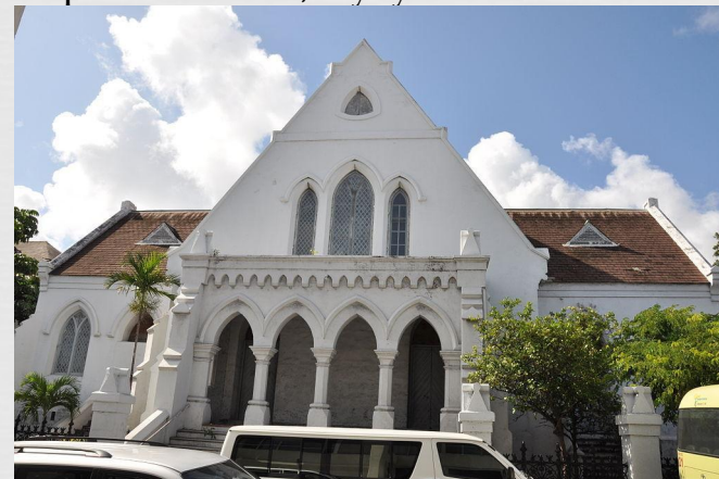
Християнська церква в Нассау