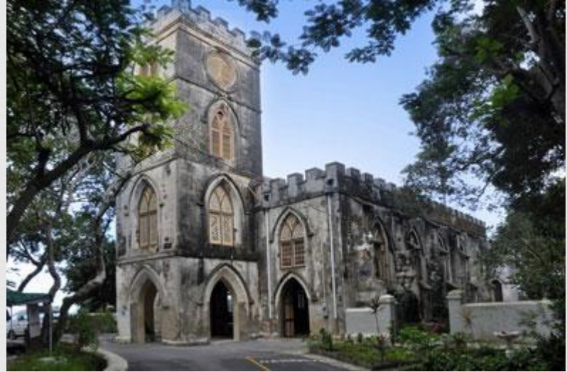
St. John's Parish Church

На Барбадосі англікани складають 53% населення. Є також методисти (9%), моравські брати (2%), п'ятидесятники і багато інші групи протестантів. Римських католиків - 4%. Є невеликі групи індуїстів, мусульман і Юдеїв.