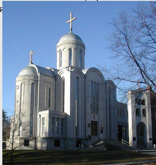
Свято-Миколаївський собор. м. Вашингтон

Послідовників православ'я в Сполучених Штатах - 4,2 млн. чоловік. Проте в країні немає єдиної православної церкви, а є 14 окремих православних національних церков, причому іноді навіть у межах однієї національної групи православні дробляться на кілька церковних організацій. Так, православні російського походження (1107 тис.) утворюють три організації: Підлеглі патріарху (московським) парафії Російської православної церкви в США (52 тис.), Православна церква в Америці (1 млн) і Російська православна церква поза Росії (55 тис.) . Перша організація, як видно з її назви, є філією Російської православної церкви, друга організація підтримує зв'язки з цією церквою, але управляється самостійно, третя ніяк не пов'язана з Російською православною церквою і є антирадянським угрупованням.