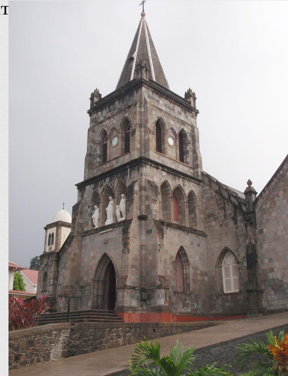
Собор Пресвятої Діви Марії м. Розо

На Домініку переважають католики (65 тис.). Протестантів (методистів, англікан, п'ятидесятників, баптистів, послідовників Церкви Христа, адвентистів сьомого дня, свідків Єгови) на острові порівняно небагат