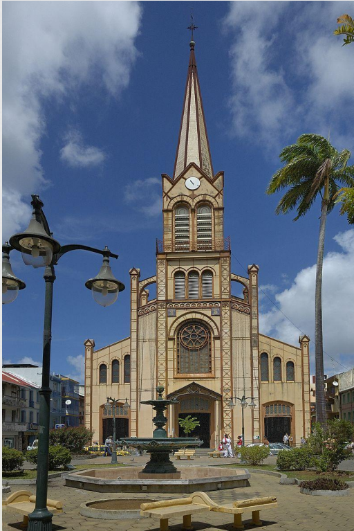
Кафедральний Собор Св. Луїзи Фор-де-Франс

Острів Мартініка є по-суті другим "заморським департаментом" Франції у Вест-Індії. Тут католицизм сповідує понад 9/10 всіх громадян. З протестантів найбільш значну групу утворюють адвентисти сьомого дня - 10 тис. Є також свідки Єгови і євангелісти.