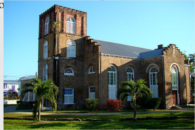
Англіканський собор в Белізі