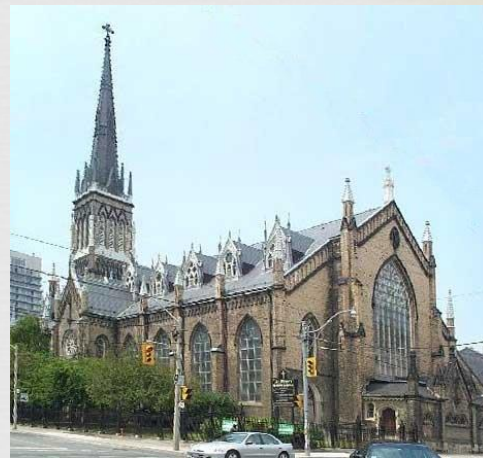
Собор святого Михайла, м. Торонто

Значно менша кількість православних (315 тис., або 1,3% населення, в тому числі сучасні послідовники Української греко-православної церкви Канади - 140 тис., прихильники Антіохійської православної християнської церкви - 25 тис., а також члени Російської, Білоруської, Румунської, Болгарської та Грецької православних церков) і українських католиків (191 тис., або 1% населення, згідно перепису 1981 р.).