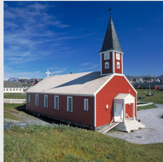
Храм Христа спасителя, м. Нуук