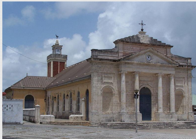
Храм Св. Івана Хрестителя

На острові Гваделупа („ заморський департамент " Франції) панує католицизм (католики утворюють більше 9/10 всього населення). З протестантів представлені адвентисти сьомого дня, однак чисельність їх невелика. Є також невелика група бахаїсти.