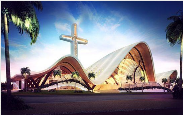
Проект базиліки нового покоління «Basilica In Cancun».

Переважна більшість населення (96%) - католики. Протестанти утворюють близько 2% населення, серед них найбільше п'ятидесятників - понад 1 млн. і пресвітеріан (127 тис.). Є також послідовники Вільних церков (70 тис.), адвентисти сьомого дня (100 тис.), свідки Єгови (100 тис.), методисти (70 тис.), баптисти (36 тис.), прихильники Єпископальний церков (9 тис.), назаряне (30 тис.), послідовники Паломницький церкви святості (30 тис.), лютерани (8 тис.), прихильники Мексиканської індіанської місії, меноніти. Крім того, в країні проживає 37,5 тис. сповідників Юдаїзму і невелике число бахаїстів.