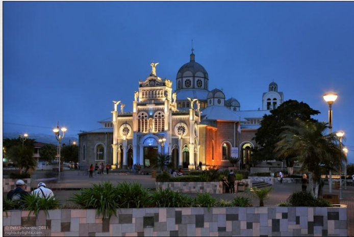
Базиліка Богоматері Ангелів, Картарго

Католики складають основну частину (90%) населення країни. Протестантизм (7% населення) представлений прихильниками Протестантської єпископальної церкви в Центральній Америці, методистами (4 тис.), адвентистами сьомого дня (5 тис.), п'ятидесятників (20 тис.), баптистами (3 тис.), англіканами (2 тис.). У країні є і прихильники