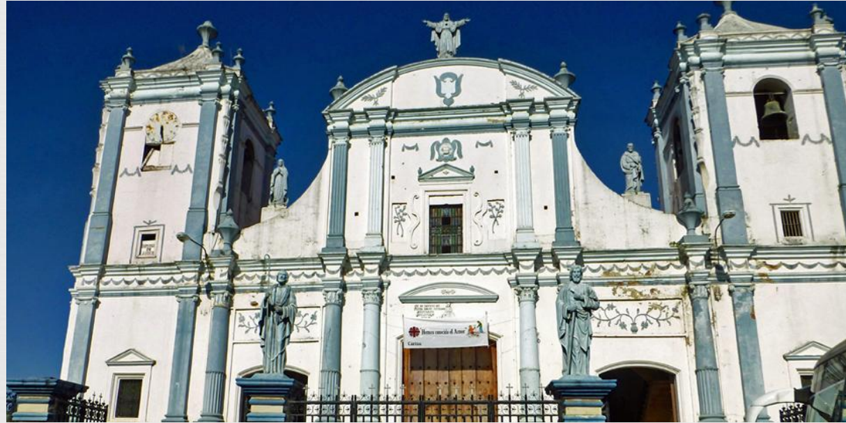
Католицький храм Сан Педро

Поряд з основною масою католицького населення є і протестанти, зосереджені головним чином на Атлантичному узбережжі. Переважають моравські брати (32 тис.) і п'ятидесятники (31 тис.). Зустрічаються також баптисти (12 тис.), адвентисти сьомого дня (5 тис.), англікани (3 тис.) та ін. Є маленька група Юдеїв (200 чоловік).