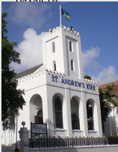
Пресвітеріанська церква святого Андрія

На Багамських островах переважають протестанти. Налічується близько 280 тис. протестантів Це баптисти (50 тис.), англікани (38 тис.), методисти (12 тис.), п'ятидесятники (10 тис.), адвентисти сьомого дня (10 тис.), пресвітеріани, послідовники Армії порятунку. Є також католики (40 тис.) і невеликі групи православних, мусульман і бахаїсти