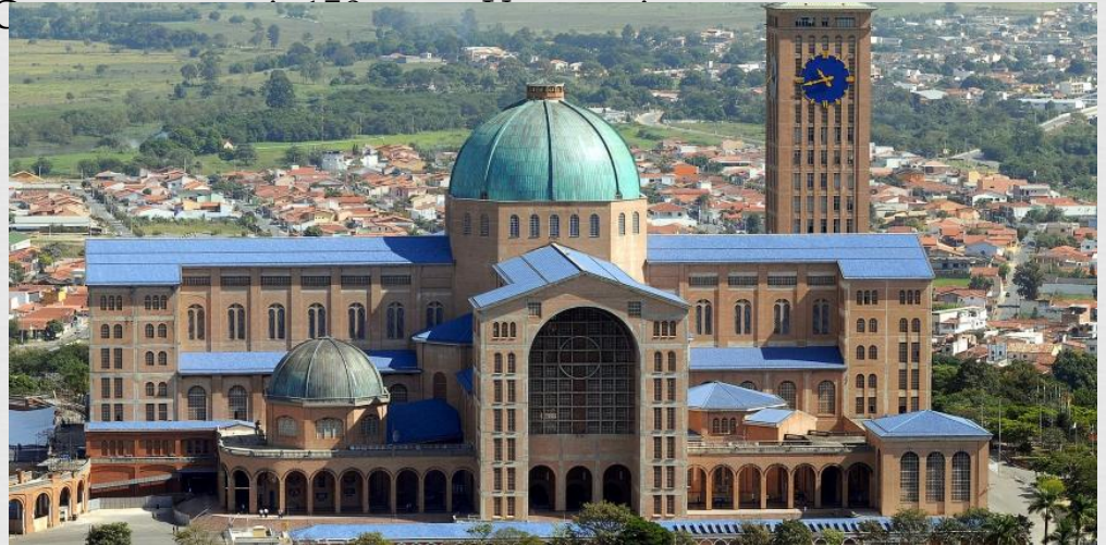
Національне святилище Богоматері Апаресіди

У Бразилії, найбільшій латино-американській країні, католики становлять більшість населення (92%). Протестантів в цій країні понад 10 млн. чоловік. Найбільш велику групу утворюють п'ятидесятники (5,8 млн.). Крім того, є баптисти (1,1 млн.), лютерани (815 тис.), пресвітеріани (807 тис.), конгрегаціоналістів (77 тис.), методисти (94 тис.), адвентисти сьомого дня (300 тис.), прихильники Бразильської єпископальної церкви (45 тис.), реформати (] 2 тис.), меноніти (9 тис.), прихильники Армії порятунку. Наприкінці 1971 р. у Бразилії налічувалося 759 тис. спірітуалістів. Ю буддисти і бахаїсти.