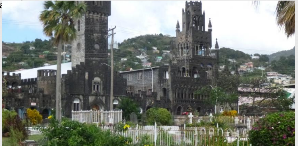
Кафедральний Собор Св. Марії м. Кінгстаун

На Сент-Вінсент і Гренадини переважно протестантський населення. Переважають англікане (30 тис.) і методисти (10 тис.), їм помітно поступаються пресвітеріани, прихильники Армії порятунку, адвентисти сьомого дня, члени Паломницької церкви святості, Плімутські брати, п'ятидесятники, баптисти, свідки Єгови, послідовники Церкви бога. Католиків порівняно небагато.