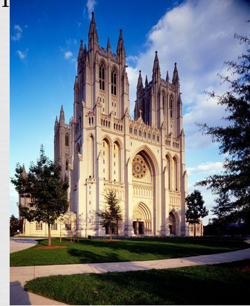
Вашингтонський кафедральний собор – головний собор англiканської Єпископальної церкви США

Досить багато членів мають і три близькі один до одного церковні організації: Церкви Христа (1600 тис.), Християнська церква (учні Христа, 1150 тис.), Християнські церкви та церкви Христа (1063 тис.). У 1957 р. в результаті об'єднання більшої частини конгрегаціоналістів і реформатів була створена нова велика церковна організація - Об'єднана церква Христа (1702 тис.). Ряд реформатських церков і деякі конгрегаціоналістської церкви до цього об'єднання не увійшли. Серед них найбільш значні Реформатська церква в Америці (346 тис.), Християнська реформатська церква в Північній Америці (302 тис.), Національна асоціація конгрегаціональних християнських церков (104 тис. членів) і т. д.