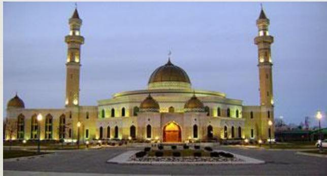
Ісламський культурний центр, штат Мічиган. Найбільша мечеть в США

З нехристиянських релігій у США широко представлений іудаїзм. У країні - 5921 тис. Юдеїв. Крім того, у Сполучених Штатах є мусульмани (2 млн.; серед них особливу групу утворюють бахаїсти, яких налічується 100 тис.), буддисти (60 тис., частина японців і китайців, а також невелика група осіб європейського походження) і представники інших релігій