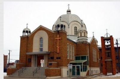
Кафедральний собор великомучениці Варвари м. Едмонтон