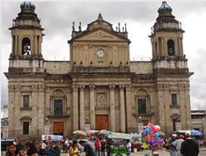
Католицький Кафедральний собор, Гватемала

Католицизм сповідує велика частина населення. З протестантів представлені баптисти (16 тис.), пресвітеріани (36 тис.), різні групи п'яти-Десягніков (127 тис.), квакери (7 тис.), адвентисти сьомого дня (25 тис.), назаряне (15 тис.), лютерани (3 тис.), методисти (2 тис.), англікани і, впливають також мормони. Юдаїзм сповідують - 2 тис. чоловік. В країні живе невелике число бахаїстів. Також є православні.