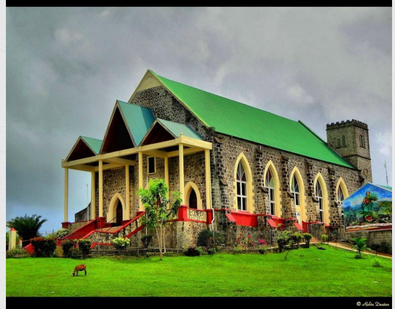
Римо-Католицький храм, м. Тіволі

Основну масу віруючих (64% населення) складають католики і на острові Гренада. Однак на цьому острові чимало і протестантів. Це англікани (22% населення), а також адвентисти сьомого дня (3%), методисти (2%), пресвітеріани, Плімутські брати, прихильники Армії порятунку, баптисти.