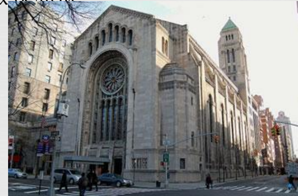
Синагога на 5 авеню, Нью-Йорк