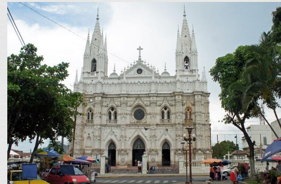
Собор єпархії Санта-Анна