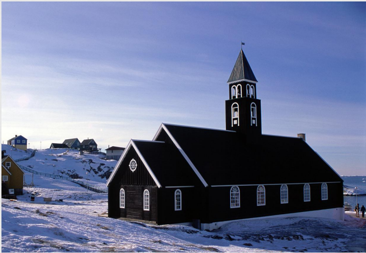
Церква Зіон, м. Ілусіат.

Острівна країна Гренландія є автономною територією у складі Королівства Данія, розташована на крайній півночі Америки. В країні майже всі віруюче населення - лютерани. Католиків лише близько 50 осіб.