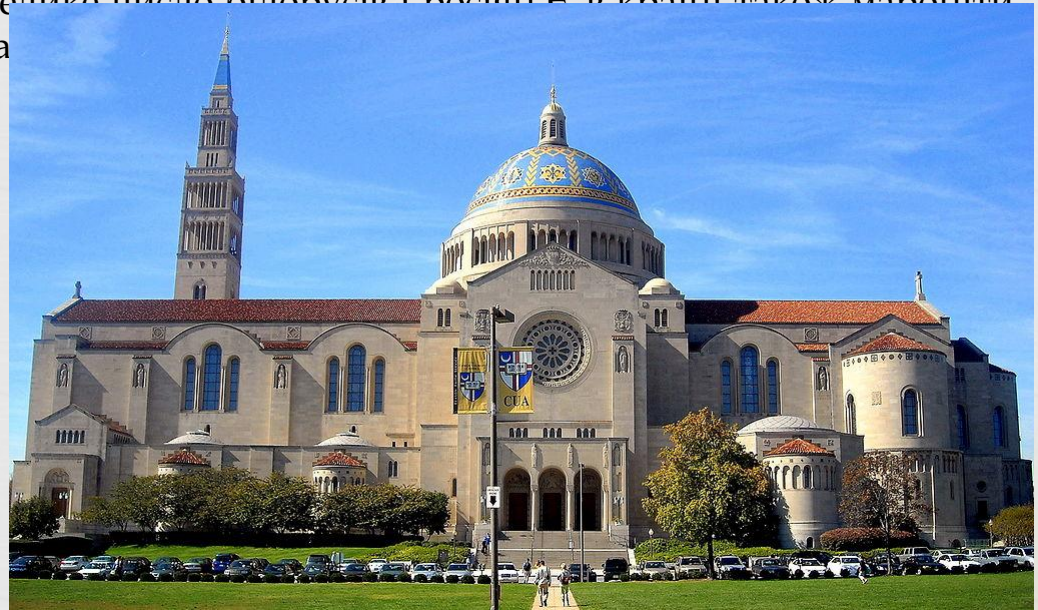
Базиліка Непорочного зачаття Пресвятої Діви Марії, Вашингтон

З окремих церковних організацій найбільше число послідовників має Римська католицька церква (52 млн чоловік). Католики в США це в першу чергу нащадки вихідців з Ірландії, Італії, Польщі та інших країн із переважно католицьким населенням. Крім католиків латинського обряду в США є також католики східних обрядів (так звані уніати) Серед уніатів різко переважають греко-католики У переважній більшості це українці (близько 550 тис.), а також араби-мелькитів (55 тис.), румуни (5 тис.), італійські греки, угорці, хорвати, невеличке число білорусів і росіян. В країні також мароніти (153 тис.), вірмено-католики (5 тис.), сиро-ка