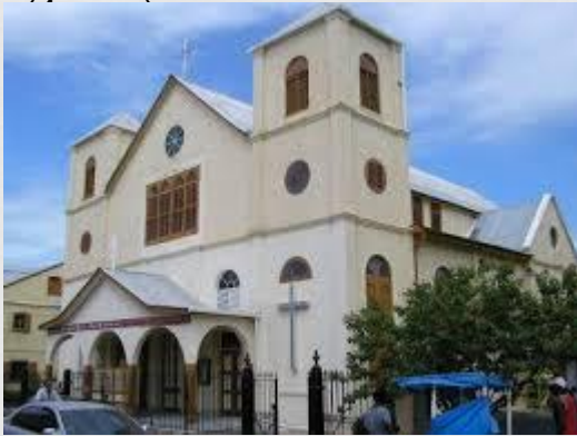
Holy Redeemer Cathedral, Беліз

У Белізі, що отримав в 1981 р. незалежність, католики складають 65% населення, протестанти - 40%. Серед протестантів переважають англіканів (16 тис.), є також методисти (3 тис.), меноніти (6 тис.), адвентисти сьомого дня (2 тис.), свідки Єгови (1 тис.), баптисти, пресвітеріани, послідовники Армії порятунку. Які тут живуть, вихідці з Індії та Пакистану та їхні нащадки дотримуються індуїзму та ісламу. У Белізі є тако