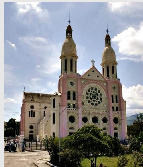
Собор Везнесіння Діви Марії