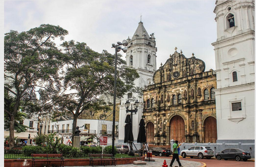
Базиліка Св. Марії м. Панама

Католики складають 87% населення. Найбільшою протестантською групою є п'ятидесятники. Їх налічується 33 тис. Чимало прихильників Протестантської єпископальної церкви (15 тис.). Є також адвентисти сьомого дня (13 тис.), методисти (5,5 тис.), баптисти (9 тис.) й інші протестанти. Трохи є Юдеїв (2 тис.) і бахаїстів.