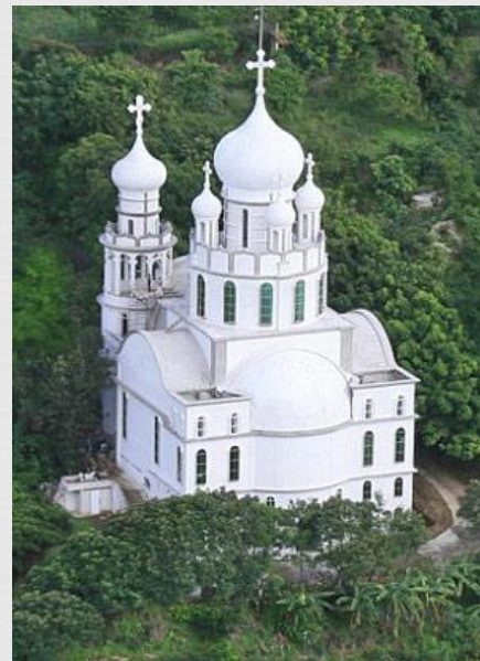
Головний храм Свято-Троїцького монастиря «Лавра Мамбре»