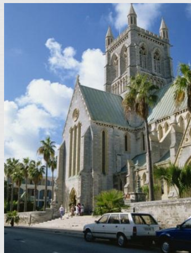
Бермудський собор Пресвятої трійці