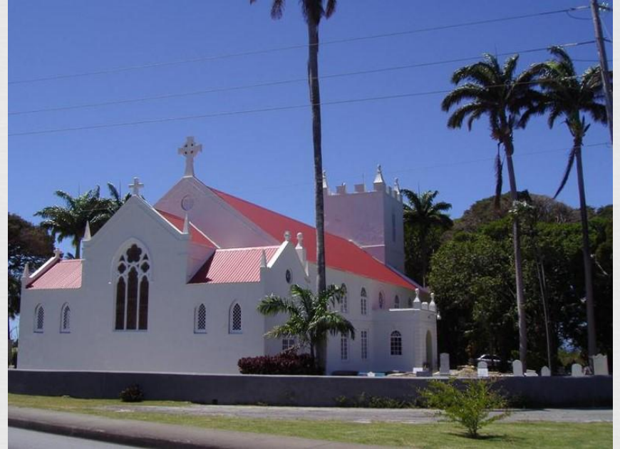
St. Lucy's Parish Church

На Сент-Люсії католики утворюють переважна більшість населення. Є невелика кількість протестантів: англікани (3% населення), адвентисти сьомого дня (2%), методисти, баптисти, свідки Єгови, послідовники Армії порятунку, п'ятидесятники. Є також маленька група бахаїстів.