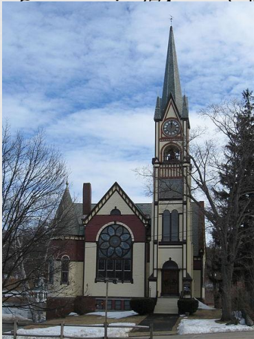
Баптиська церква в Нью-Гемпширі, побудована у 1891 р.

Найбільшу групу серед протестантів США утворюють баптисти. Повноправних членів баптистських громад -25,5 млн. Їх об'єднують 15 самостійних церковних організацій, з яких більш-менш значними є Південна баптистська конвенція (13 998 тис. членів). Національна баптистська конвенція США (6300 тис., об'єднує баптистів-негрів), Національна баптистська конвенція Америки (2669 тис., також об'єднує негрів), Американські баптистські церкви в США (1617 тис.), Американська баптистська асоціація (1350 тис.), Прогресивна національна баптистська конвенція (522 тис.), Національна конвенція "примітивних баптистів" (250 тис.), Генеральна асоціація регулярних баптистських церков (301 тис.), Національна асоціація баптистів вільної волі (217 тис.), Консервативна баптистська асоціація Америки (237, 5 тис.), Баптистська місіонерська асоціація Америки (228 тис.), Баптистська генеральна конференція (133 тис.), Об'єднана церква баптистів вільної волі (100 тис.), Генеральна асоціація загальних баптистів (72 тис.), "примітивні баптисти" (72 тис.) і ін