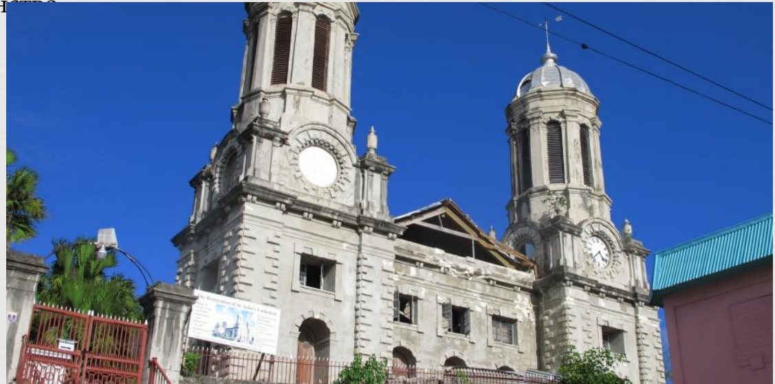
Кафедральний Собор Сен-Джонс

На що отримали в 1981 р. незалежність островах Антигуа і Барбуда переважає протестантизм. Близько половини населення утворюють англікани (60 тис.), є також моравські брати, методисти, члени Веслеянської церкви святості, адвентисти сьомого дня, п'ятидесятники, баптисти. Чисельність католиків невелика. Є невелика група бахаїстів. На підпорядкованому Антигуа в адміністративному відношенні острові Барбуда повністю панує англіканство.