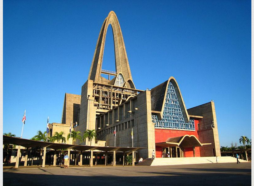
Католицька базиліка в Ігує

У Домініканській Республіці католики становлять понад 90% населення Протестантів - 110 тис. Серед них є послідовники Домініканській євангельської церкви (02 тис), п'ятидесятники (38 тис.) методисти (2 тис), адвентисти сьомого дня (20 тис.), послідовники Протестантської єпископальної церкви (3 тис.), баптисти та іудаїстів -200 чоловік. Є також невелика група бехаїстів.