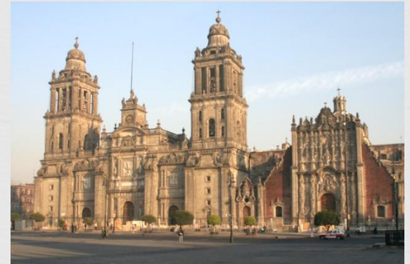
Собор успіння Пресвятої Богородиці. Мехіко