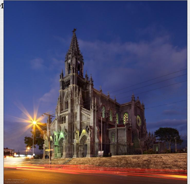
Церква в Коронадо