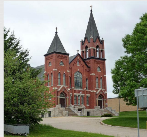
Лютеранська церква в Хармоні, штат Міннесота

Лютерани США (8,5 млн.) об'єднані в 11 церковних організацій. Серед них найбільші: Лютеранська церква в Америці (3051 тис.), Лютеранська церква - Міс-рійський синод (2750 тис.), Американська лютеранська церква (2343 тис.), Вісконсінський євангелічний лютеранський синод (410 тис.), Асоціація євангельських лютеранських церков (108 тис.).