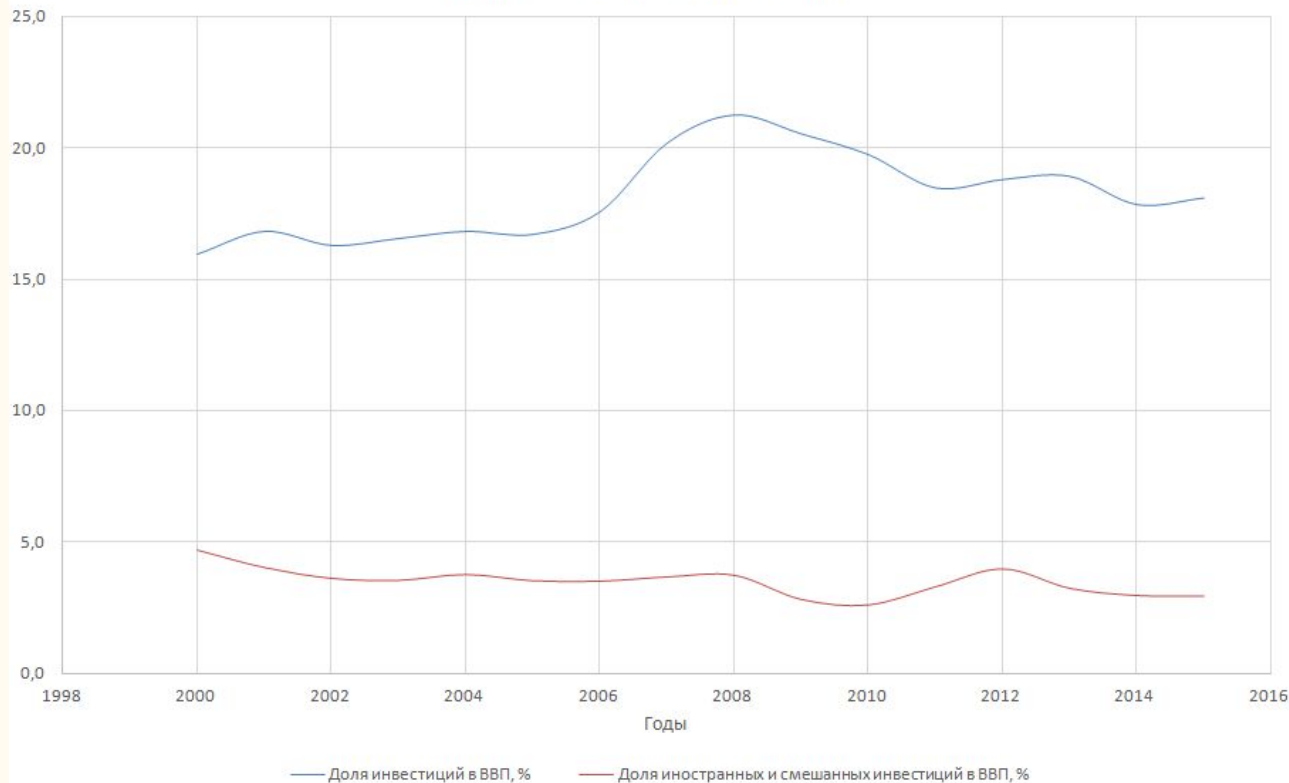
Доля инвестиций в ВВП России, %

На первом графике приведена динамика общей доли инвестиций и доля суммы иностранных и смешанных инвестиций в ВВП. Падение доли инвестиций в ВВП с 2008 года продолжается, однако в 2015 года их доля немного выросла, доля иностранных и смешанных иностранцев почти не меняется.