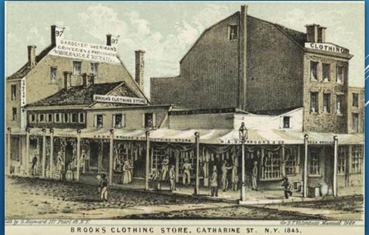
Первый магазин «Brooks Brothers» в Нью-Йорке, 1845

К 1969 году розничная сеть «Brooks Brothers» насчитывала 10 магазинов — в Манхэттене, Чикаго, Бостоне, Сан-Франциско, Питтсбурге, Лос-Анджелесе, Атланте и Вашингтоне.