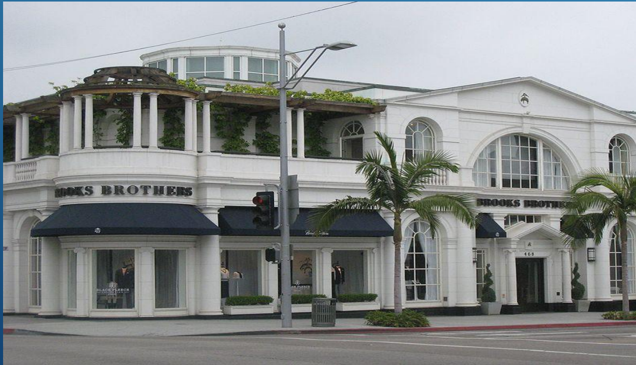
Магазин Brooks Brothers на Беверли-Хиллз, Калифорния

В 2011 году ретейл-сеть «Brooks Brothers» насчитывает 210 магазинов в США и 70 в других странах, включая Японию, Китай, Тайвань, ОАЭ, Францию, Великобританию, Чили, Канаду, Италию, Мексику и Грецию. Главные магазины расположены в Манхэттене, Чикаго, Бостоне и Беверли-Хиллз.