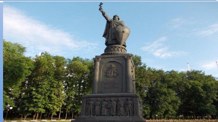
Памятник Равноапостольному Князю Владимиру