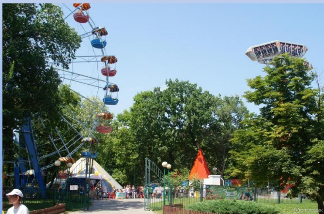
Парк аттракционов «Луна парк»