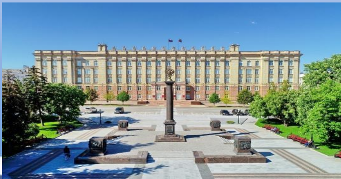
Стела «Город воинской славы» Белгорода

Ход игры: Сначала взрослый показывает детям фотографии с изображением достопримечательностей города Белгорода, а дети называют их. Затем ребятам предлагается запомнить фотографии в течение 30 сек. Далее дети закрывают глаза, а взрослый убирает 1 фотографию. По сигналу ребята открывают глаза и пытаются угадать недостающую фотографию и называют её. Игра проводится несколько раз.