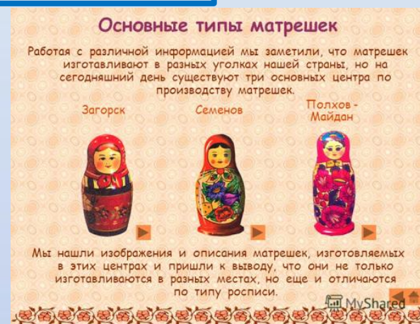
Так выглядели первые русские матрёшки.

Ход игры: Взрослый показывает детям игрушки-матрешки: Украинская, Семеновская, Русская, Кировская (Вятская), обращая внимание на цветовую гармонию, особенности росписи. Затем ребятам предлагается запомнить матрешек в течение 30 сек. Далее дети закрывают глаза, а взрослый убирает 1 фотографию. По сигналу ребята открывают глаза и пытаются угадать недостающую матрешку и называют её. Игра проводится несколько раз.