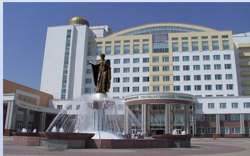
Белгородского государственного национального исследовательского университета