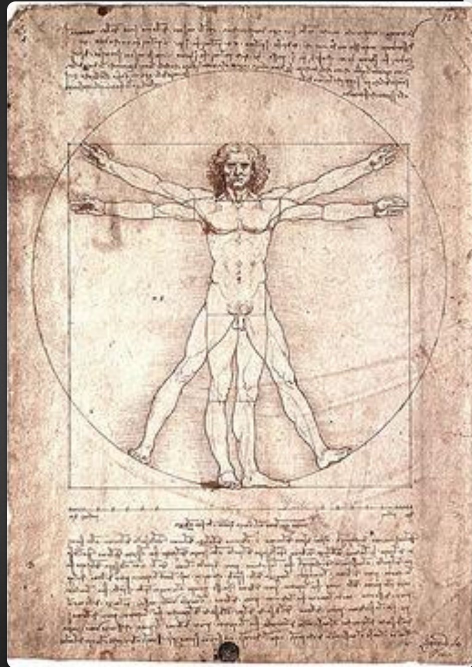
Рисунок является одновременно научным трудом и произведением искусства, также он служит примером интереса Леонардо к пропорциям.

При более детальном исследовании оказывается, что центром круга является пуп фигуры, а центром квадрата — половые органы.