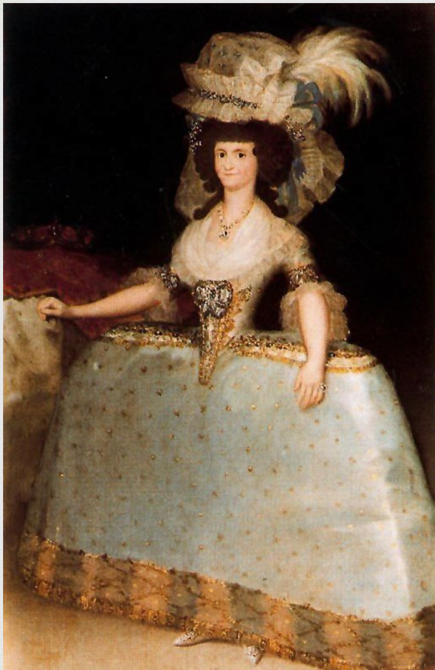
Портрет испанской королевы Марии Луизы 1787