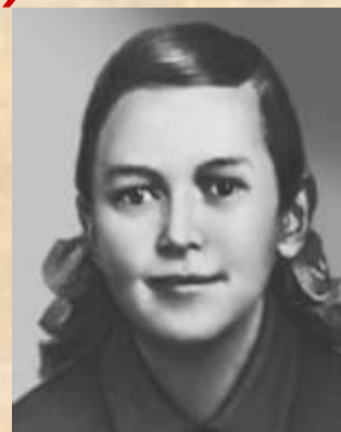
Подпольщица, партизанка Зина Портнова