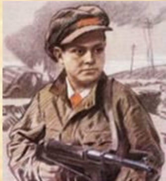
Партизан-разведчик Лёня Голиков

Не щадя себя в огне войны, Не жалея сил во имя Родины, Дети героической страны Были настоящими героями!