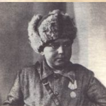
Партизан-разведчик Лёня Голиков