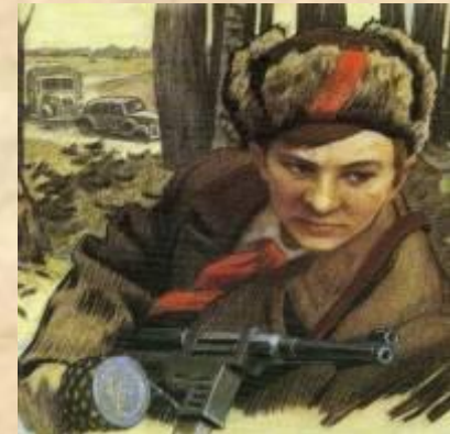
Самый юный Герой Советского Союза Валя Котик

Не щадя себя в огне войны, Не жалея сил во имя Родины, Дети героической страны Были настоящими героями!