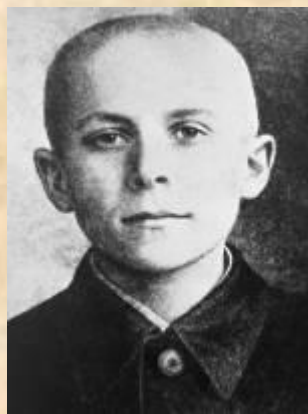
Разведчик партизанской бригады Марат Казей