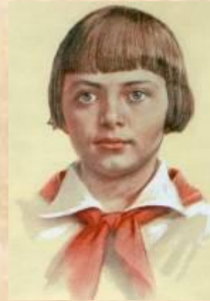
Подпольщица, партизанка Зина Портнова