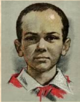
Разведчик партизанской бригады Марат Казей