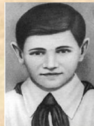
Самый юный Герой Советского Союза Валя Котик

Не щадя себя в огне войны, Не жалея сил во имя Родины, Дети героической страны Были настоящими героями!